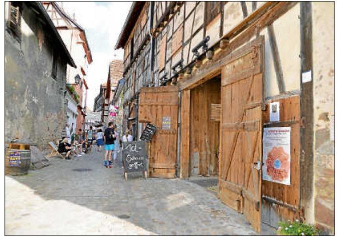
Die Zehntscheuern öffneten ihre Pforten.