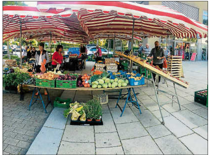
Frische Vielfalt am Obst- und Gemüsestand auf dem Gernsbacher Wochenmarkt.

Empfohlen wird, mit dem ÖPNV, zu Fuß oder mit dem Rad zu kommen. Parkmöglichkeiten sind am Salmenplatz, am Kino, am Färbertor, am Kelterplatz, auf dem Parkplatz am Bahnübergang Kurpark sowie auf der Igelbach- und Bleichstraße vorhanden. ■