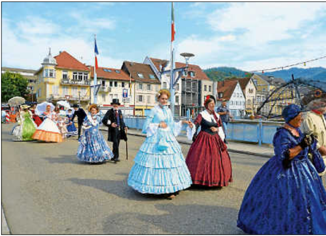
Auch die Hecker- und Biedermeiergruppe flanierte über das Fest.