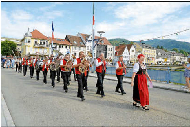
Die Stadtkapelle zieht über die Stadtbrücke zur offiziellen Eröffnung.