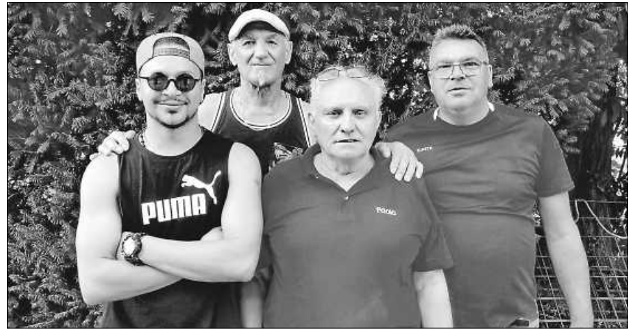
Vereinsmeister Tête à Tête 2023

meister in der Formation Tête à Tête aus. In mehreren Spiel-Runden wurde der stärkste Spieler ermittelt. Vereins-