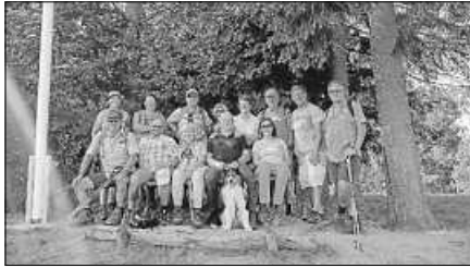
Teilnehmer der Wanderung.

zu genießen) und Johannesplatz. Dazwischen wurden weitere verdiente Pausen im Freibad und am Wegkreuz eingelegt. Nach der Wanderung wurde am SCG-Clubhaus gegrillt und über die bevorstehende Wintersaison gesprochen.