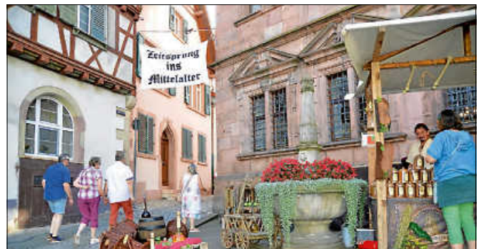
Zeitsprung ins Mittelalter.