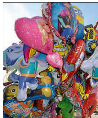
Folienballons ließen kleine Besucherherzen höher schlagen.