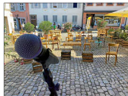
Bühne frei: Der Platz vor dem Kornhaus bietet den perfekten Rahmen für musikalische Performances.

lebendigen Veranstaltung in der Altstadt von Gernsbach einzubringen. ■