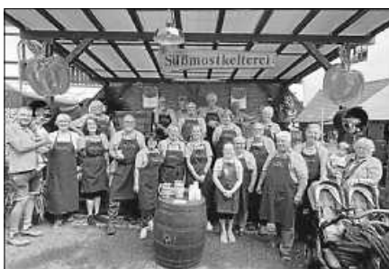
Das Süßmostteam des Altstadtfestes 2023

Jetzt geht's noch ans Aufräumen und Verwahren der hölzernen Fässer und Bottiche, bis sie im nächsten Jahr wieder zum Altstadtfest aus den Lagern geräumt werden.