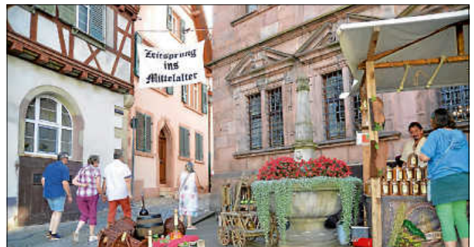
Zeitsprung ins Mittelalter.