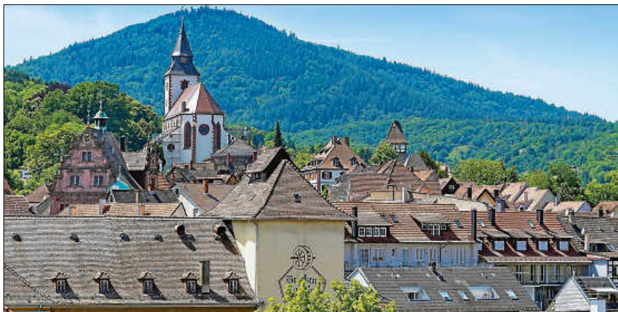
Blick über die Dächer der charmanten Altstadt von Gernsbach.

Altstadtentwicklungskonzept finden Sie unter: www.gernsbach.de/altstadt . ■