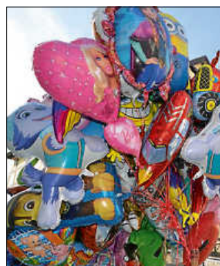
Folienballons ließen kleine Besucherherzen höher schlagen.