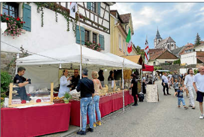
Am Stand der Partnerstadt Pergola konnte man italienische Köstlichkeiten erwerben.