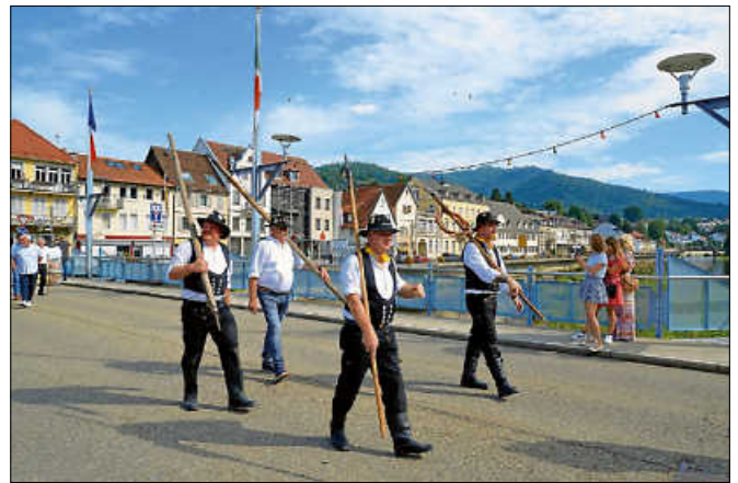
In traditionellem Gewand nahmen die Flößer an der Eröffnung teil.