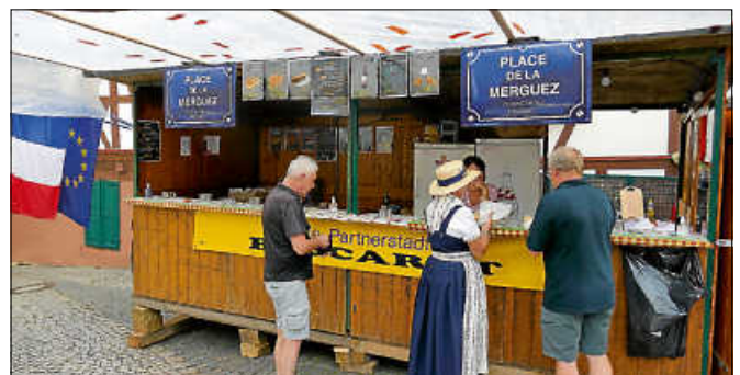
Die Partnerstadt Baccarat bot französische Spezialitäten am angestammten Platz.