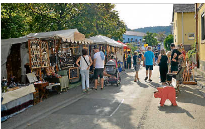
Mittelalterliches Kunsthandwerk gab es in der Storrentorstraße.