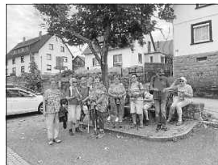
Die Dienstagswanderer auf dem Weg nach Bermersbach.

Am 27. September treffen sich die Mittwochswanderer um 8.45 Uhr am Bahnhof Gernsbach zur Fahrt nach Forbach. Von dort wandern wir den Buisbergweg hinauf in Richtung Bermersbach. Dann geht es weiter über das Gelände des Vereinsheims der Turner in Richtung Riedkopf-Rundweg, durch ein Wiesental zum Wildgehege. Danach wandern wir runter zum Glücksweg und dort zu unserer Mittagspause (mitgebrachte Rucksackverpflegung). Gut gestärkt beginnt der Aufstieg entlang des Scheerbaches zum Bermersbacher Grat, mit herrlichen Aussichten ins Tal bis hin zur Aussichtskanzel, und dann über die Giersteine zurück nach Forbach. Die Länge der Wanderung beträgt ungefähr 12 km und 430 Hm, führt entlang schattiger Wege mit schönen Aussichten. Hinweis: Da wir kein Lokal haben, sind wir auf mitgebrachte Rucksackverpflegung angewiesen. Außerdem ist es angebracht, lange Hosen zu tragen, da unsere Wanderung oft durch hohes Gras führt. Für weitere Informationen: 07225 639921 oder 07224 658854.