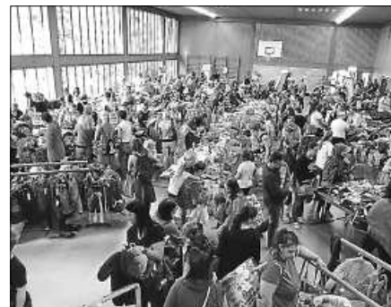
Großer Andrang beim KidsBazar.

Weitere Informationen finden Sie auch unter: www.treffpunkt-staufenberg.de . Haben Sie Fragen, schicken Sie uns eine E-Mail an: kids-bazar.staufenberg@web.de