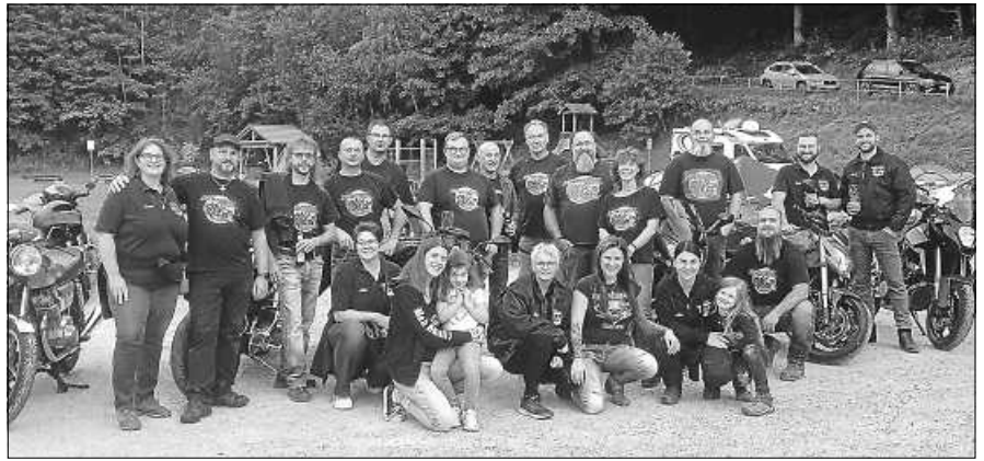
Motorradtreffen MC Gausbach