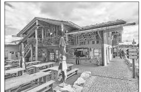
Der Abschluss beim Ausflug des Handwerkervereins findet in der Kraxl-Alm in Rutesheim statt.

Eine telefonische Anmeldung bei unserem Vorstand Dieter Hutt, 0176 97909396, ist hierzu zwingend erforderlich. Nach erfolgter Anmeldung bitten wir euch oben genannte Beträge auf das Konto des Handwerkervereins Staufenberg, IBAN DE 16 6655 0070 0060 4556 49, im Voraus zu überweisen.