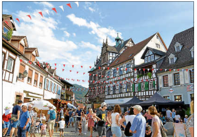
Buntes Treiben in der Altstadt.