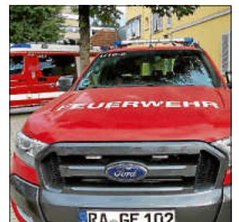
Die Einsatzkräfte von Feuerwehr, DRK und DLRG leisteten drei Tage lang Bereitschaftsdienste vor Ort.