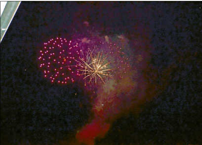
Das Musikfeuerwerk am Samstagabend war ein Besuchermagnet.