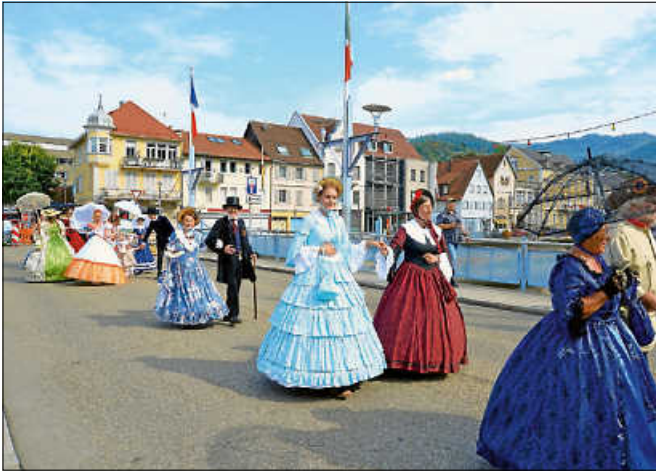
Auch die Hecker- und Biedermeiergruppe flanierte über das Fest.