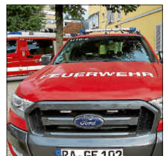
Die Einsatzkräfte von Feuerwehr, DRK und DLRG leisteten drei Tage lang Bereitschaftsdienste vor Ort.