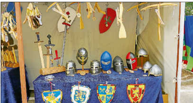
Alles, was das Ritterherz begehrt...