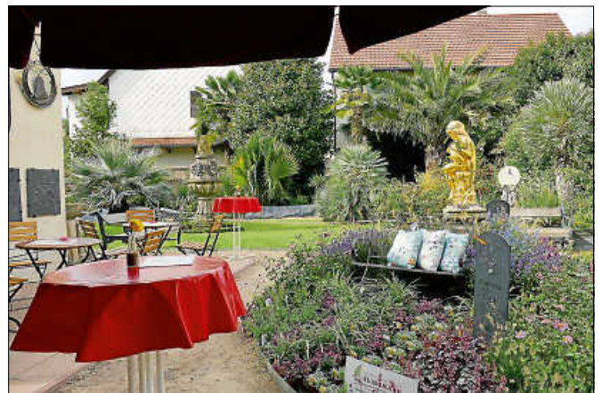
Im Katz'schen Garten gab es Führungen, eine Gartenausstellung und Bewirtung