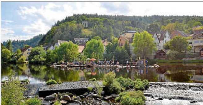
Die Murgflößer boten wieder Fahrten auf der Murg an.