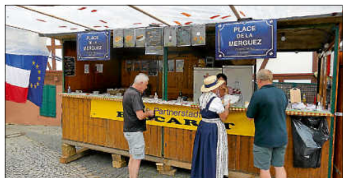
Die Partnerstadt Baccarat bot französische Spezialitäten am angestammten Platz.