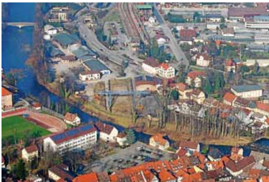
Die Mitglieder des Lenkungskreises teilen die vollständige Dekontaminierung des Pfeleiderer-Areals als gemeinsames Ziel.

Die angestrebte konsensuale Findung einer Fragestellung für den Bürgerentscheid konnte trotz engagierter Diskussionen nicht erreicht werden. Auch erlangte keine der beiden Fragen eine erforderliche Zwei-Drittel-Mehrheit. Gelingen ist es hingegen, dem Gemeinderat nun zwei konkrete Fragestellungen zur Wahl vorzulegen.