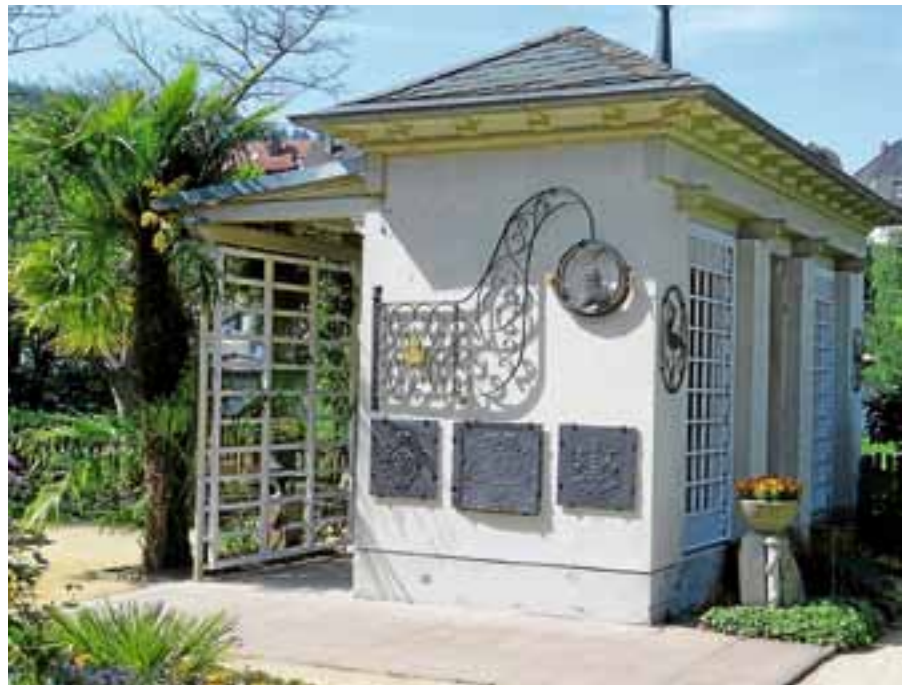
Einen Blick wert sind bei der Führung im Katz'schen Garten auch die alten Ofengussplatten, die jetzt neu am Gartenpavillon und an der Gerätehütte angebracht wurden.

Der Gernsbacher Hubertus Melsheimer, ein großer Freund des Katz'schen Gartens, vererbte zu Lebzeiten für