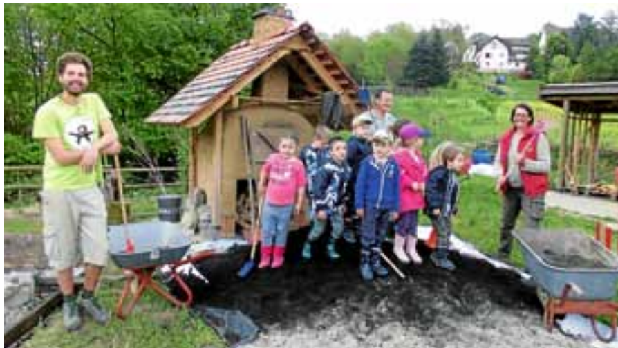
Die Kinder des 5er Clubs hatten viel Spaß auf dem Weidenhof.

Die Veranstaltung fand im Rahmen von „Heimische Bauernhöfe - von Kindern neu entdeckt!“ statt, einem Modellprojekt des Naturparks Schwarzwald Mitte/Nord. ■