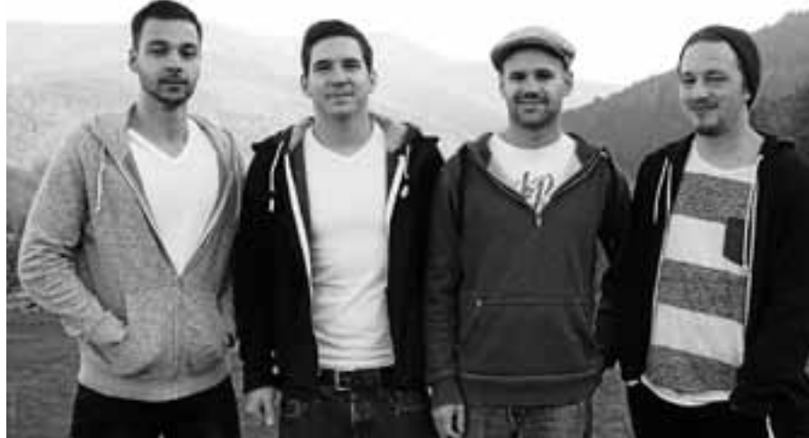
Die Band "MAC'S" spielt beim Rathausplatzfest der Motorradfreunde.

Am Samstag, 5. und Sonntag, 6. Mai, findet das traditionelle Rathausplatzfest der Motorradfreunde Reichental statt. Am Samstagabend werden ab 20.30 Uhr