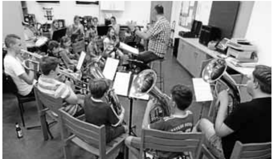
Jungmusiker und Bläserklasse proben für das Vatertags-Kurkonzert.

Am Samstag, 12. Mai, haben alle Kinder und Jugendlichen des TCG die Möglichkeit, einen großen Titel sowie einen tollen Pokal zu gewinnen. Ab 10 Uhr finden auf der Anlage die Clubmeisterschaften der Nachwuchsspieler statt. Gespielt wird in den jeweiligen Altersklassen. Teilnehmer können sich ab sofort in der Liste im Clubhaus eintragen. Im Anschluss an die Clubmeisterschaften sind alle Spieler im Anschluss an die Preisverleihung noch zu einer kleinen Grillparty eingeladen. Neben dem Titel winkt für