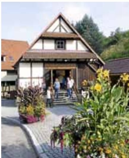
Das Waldmuseum Reichental ist ab 6. Mai wieder sonntags geöffnet. ■