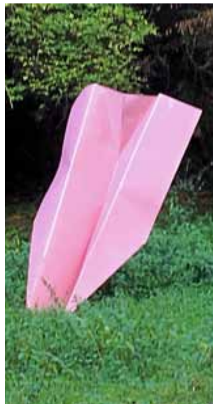
Die Edelstahlplastik „Lackierung-Faltung-Crash 2“ von Nina Laaf befindet sich seit 2016 am Kunstweg am Reichenbach.

Die Tour dauert rund zweieinhalb Stunden und findet bei jedem Wetter statt. Der Treffpunkt ist am Beginn des Kunstwegs an der Infotafel auf dem Parkplatz im Reichenbachtal hinter dem Gewerbegebiet. Anfahrts Hinweise und weitere Infos unter www.kunstweg-am-reichenbach.de ■