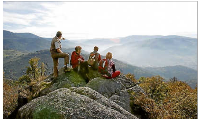
Unterwegs auf der Murgleiter.

Wanderfreunde können noch bis 30. Juni 2021 unter www.wandermagazin.de/wahlstudio für ihren Lieblingsweg abstimmen. Neben der Online-Abstimmung gibt es auch