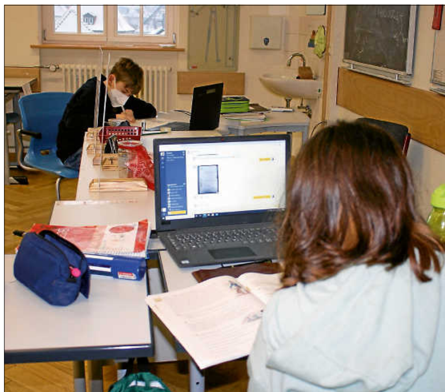
Schule beim Online-Unterricht.

Anmeldetermine: Mittwoch, 10. März 2021 Donnerstag, 11. März 2021 ■