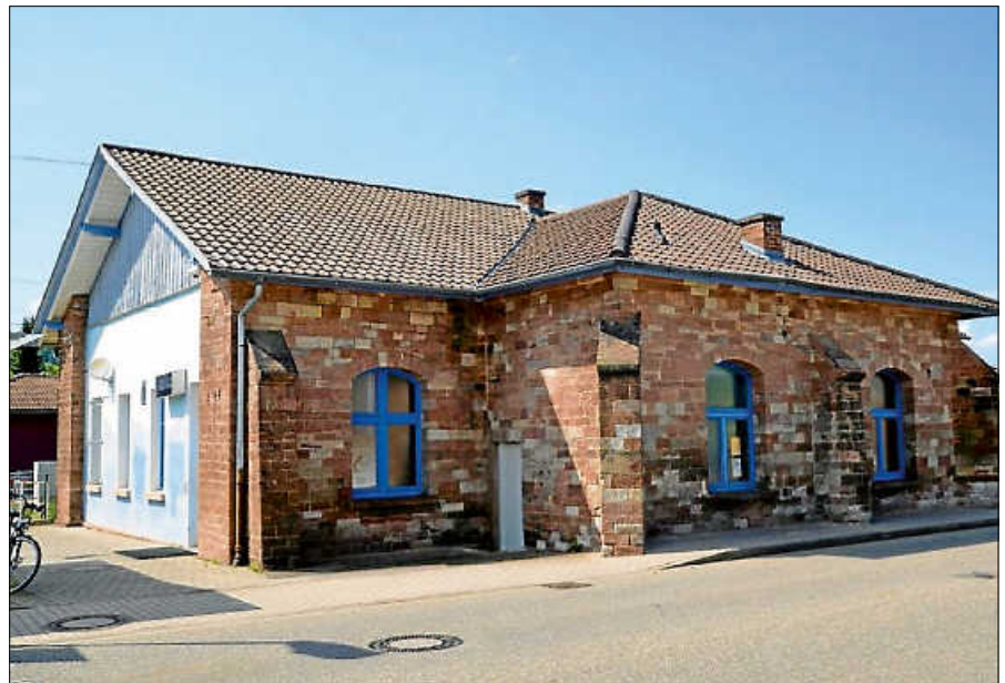
Das Kinder- und Jugendhaus in der Schwarzwaldstraße.

Als nächsten Schritt hatte die Verwaltung die Bedürfnisse der Jugendlichen im Detail erhoben. Hierfür wurde ein Online-Workshop mit Jugendlichen durchgeführt. Dabei konnte auch die Frage des optimalen Standortes für ein Kinder- und Jugendhaus bereits geklärt werden. Der bisherige Standort in der Schwarzwaldstraße hat sich bewährt, allerdings wünschten die Jugendlichen eine deutliche Aufwertung des Gebäudes, sowohl im Innen- als auch im Außenbereich. Überwiegend bestand der Wunsch, das Jugendhaus „gemütlicher und fröhlicher“ zu gestalten. Inhaltlich wurde der Wunsch nach längeren Öffnungszeiten, auch am Wochenende, geäußert. Auch würden die Jugendlichen gerne mehr Kursangebote