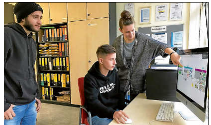
In der HLA Gernsbach werden Projekte zu Nachhaltigkeit und Digitalisierung umgesetzt.

Unter dem Schlagwort Gernsbacher Modell bietet die HLA Gernsbach die Möglichkeit, nach dem Berufskolleg über die Wirtschaftsoberschule (WO) ein vollwertiges Abitur zu erreichen. So bietet sich für Schülerinnen und Schüler ein alternativer Weg bis zur Allgemeinen Hochschulreife. Im Berufskolleg