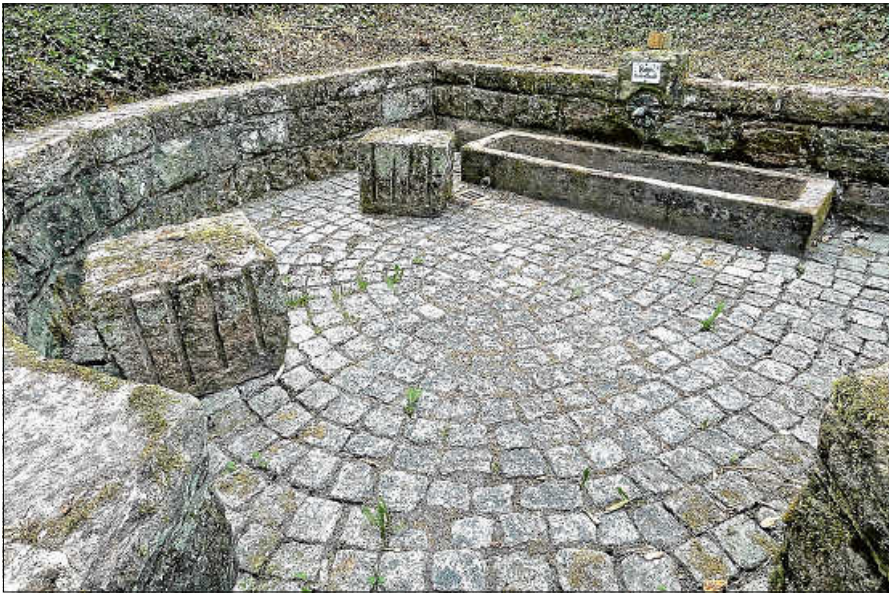
Das wieder freigelegte Rosenbrünnele.