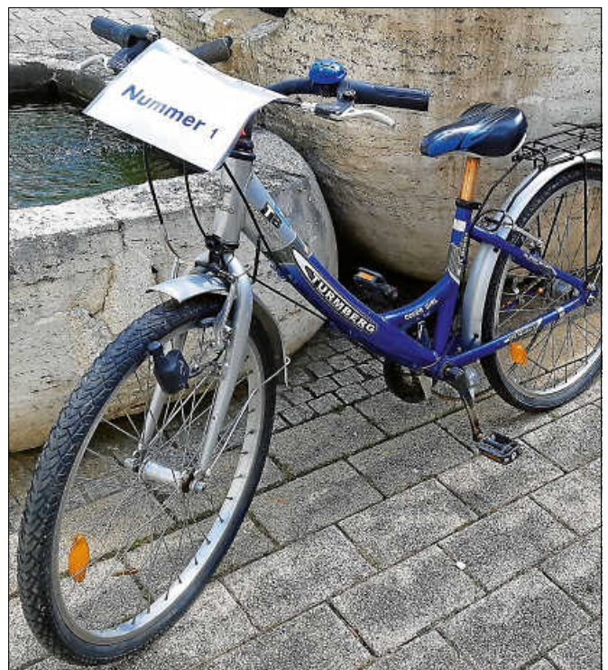
Das Fundrad-Angebot der Woche.

Das Stadtarchiv ist vom 15. August bis zum 2. September 2022 geschlossen. Um Beachtung wird gebeten.