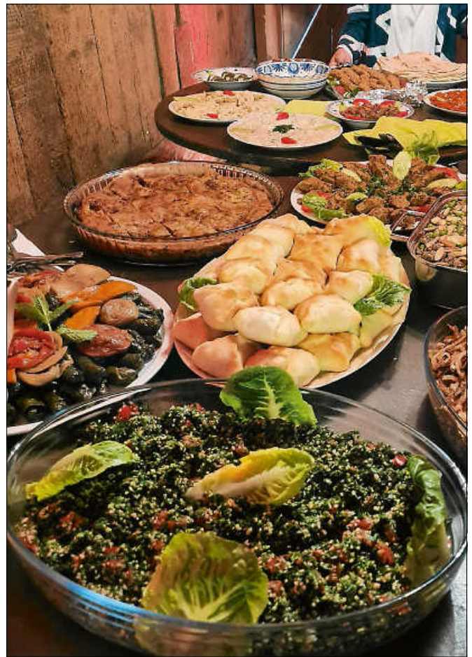
Essen verbindet: Kochabende im H10.