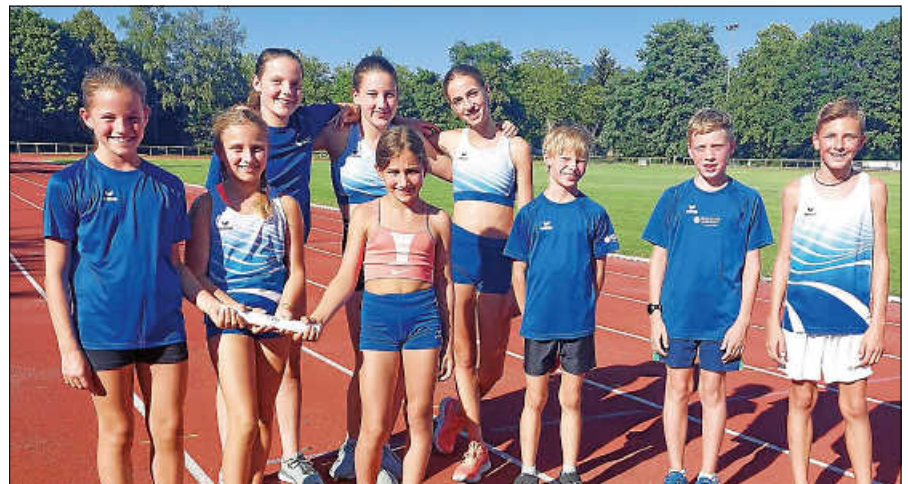
TVG Leichtathleten erfolgreich bei den 3 x 800 m Staffeln: Kreismeisterinnen WU14 (hinten); Kreismeister MU12 (vorne rechts); Platz 4 WU12 (vorne links).