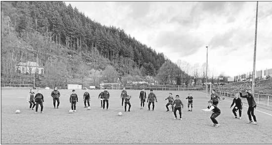
Die D-Jugend der SG Gernsbach kehrte nach fünf Monaten Pause auf den Fußballplatz zurück.

Aufgrund der aktuellen Corona-Lage verzichtet der FCG jedoch auf eine Straßensammlung. Das gesammelte Papier kann aber am Färberthorplatz in dem oben genannten Zeitfenster abgegeben werden. Am Färberthorplatz warten zwei FCG-Verantwortliche, um die Autos zu entladen. Wer möchte, kann das Papier auch selbst entladen. Während der Altpapiersammlung wird der Verein auf die Einhaltung der Corona-Regeln achten und die Abstandsregelungen einhalten.