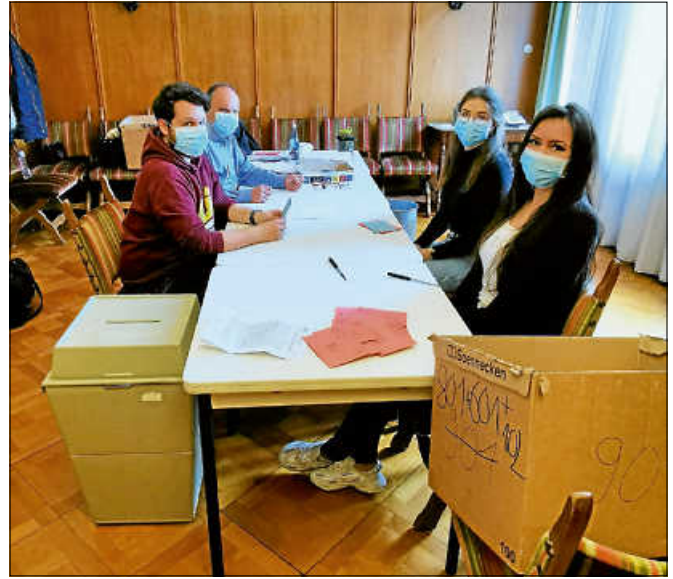
Auch im Trausaal wurde ein Briefwahllokal eingerichtet.