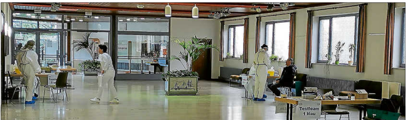
Aufbau der Coronatest-Station in der Stadthalle am Tag vor der Wahl.