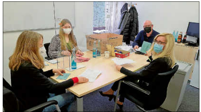
Eines von vier Briefwahllokalen im Rathaus.