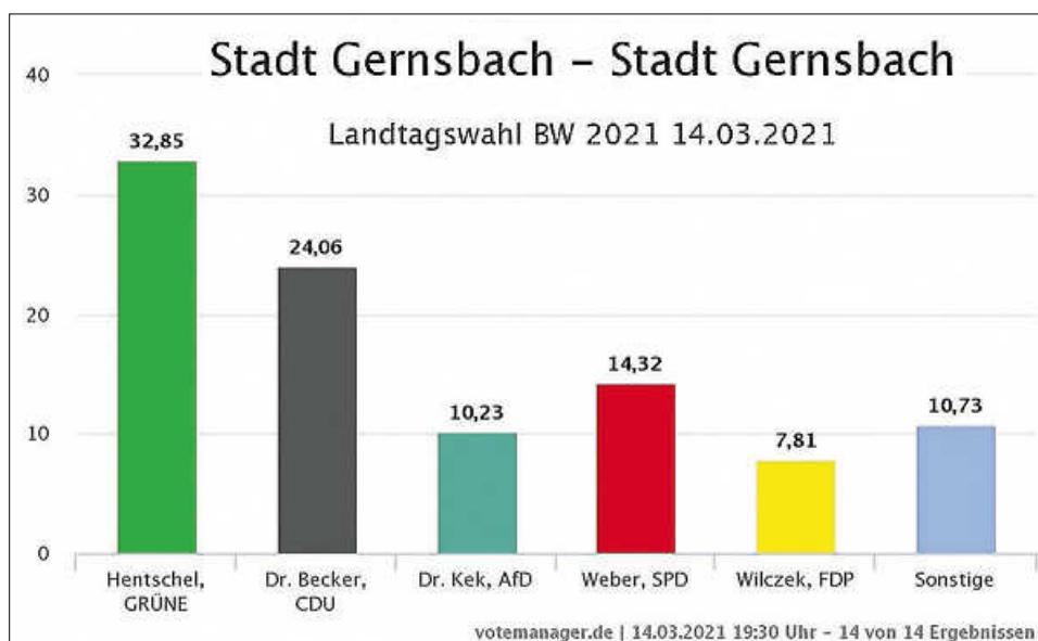
Wahlergebnisse für Gernsbach

wahl 14. März 2021' auf der Startseite unserer Homepage www.gernsbach.de . ■