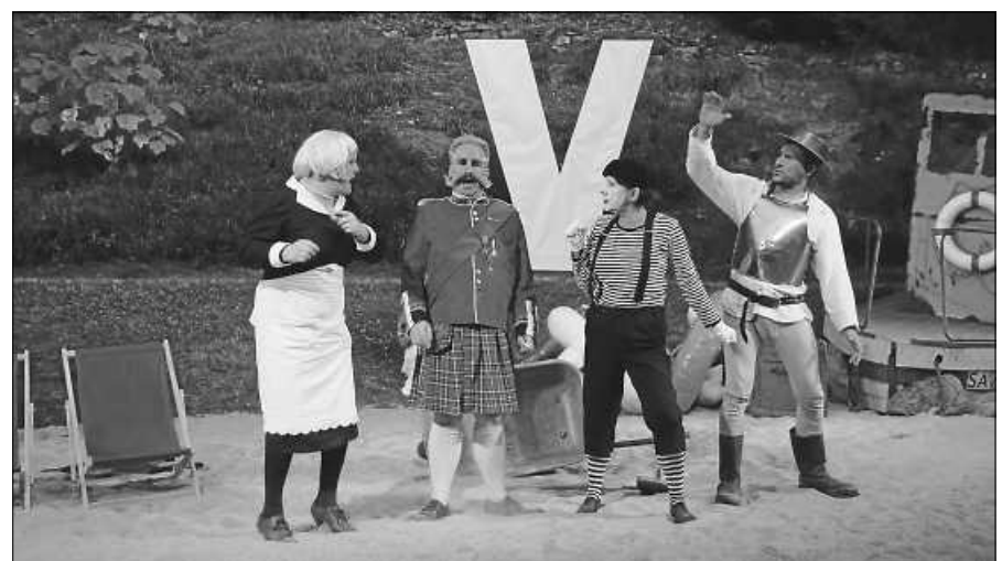
Szene aus Shakespeares ‚Was Ihr Wollt‘ 2019.

Die Bezahlung per Überweisung unter Angabe von Vor- und Nachnamen des Kindes, muss bis spätestens Mittwoch 31.03. (Geldeingang) auf das Konto der Stadtkapelle Gernsbach e.V. IBAN DE30 6655 0070 0060 0111 37, BIC SOLADES1RAS erfolgen. Oder aber Sie melden sich gegen Barzahlung in der Postagentur Brigitte Zimehl in der Schwarzwaldstraße an.