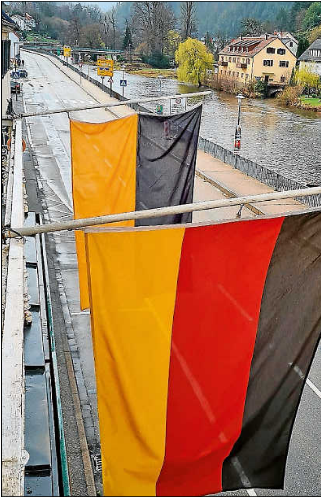
Bundes- und Landesfahne am Rathaus zum Wahltag.