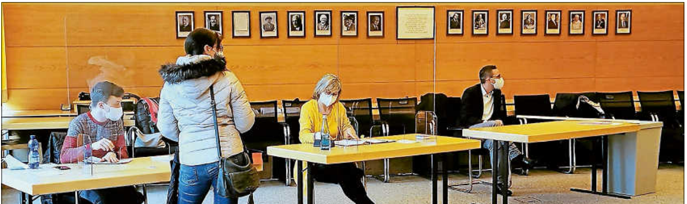
Das Wahllokal Rathaus befand sich im Sitzungssaal.