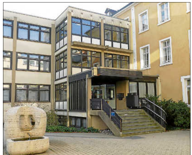
Der Zutritt zum Rathaus ist derzeit nur noch mit Terminvereinbarung möglich.