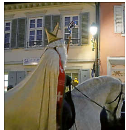
Nikolausritt durch die Altstadt 2019

„Viele Kinder haben sich bereits auf diese Ereignisse gefreut. Gerade bei den Veranstaltungen für unsere Gernsbacher Familien sind die Absagen beson-