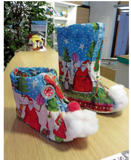
Die Nikolausstiefelaktion sorgt alljährlich für strahlende Kinderaugen.

Die Kinder dürfen sich dann ab dem ersten Advent mit ihrer Familie auf die Suche nach ihrem Schuhwerk machen und nach dem 6. Dezember im jeweiligen Geschäft ihr Geschenk abholen. ■