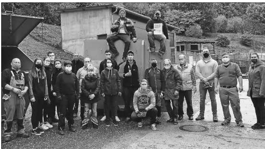
Fleißige Helfer der Altmetailsammlung.

Aufgrund der neuen Maßnahmen und Beschränkungen zur Eindämmung der Corona-Pandemie stellt der Schützenverein Obertsrot seine Aktivitäten zunächst wie vorgegeben, von Montag, 02. bis Montag, 30. November ein. In dieser Zeit finden keine Wettkämpfe statt und das regelmäßige wöchentliche Training entfällt. Auch die sonntäglichen Frühschoppen müssen wegen der verschärften Bestimmungen abgesagt werden. Wir bitten um Verständnis und hoffen, dass wir uns baldmöglichst wieder im gewohnten, sportlichen wie auch gesellschaftlichen Kreis treffen können.