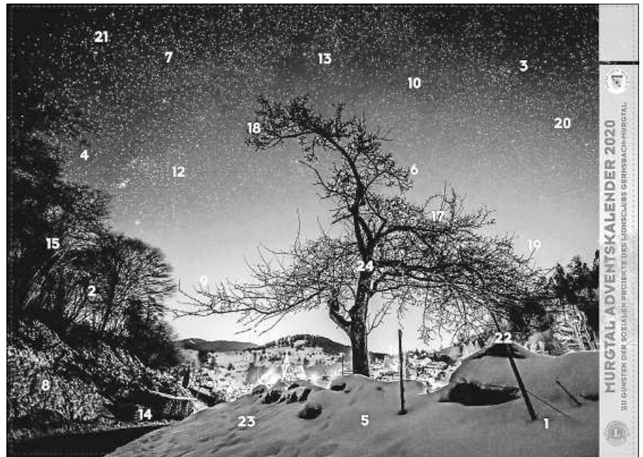
Adventskalender des Lions-Clubs

Zum 5. Mal wird der Lions-Club Gernsbach-Murgtal den Murgtal-Adventskalender in der Vorweihnachtszeit verkaufen. Wie in den Jahren zuvor kommt der Erlös vor allem Programmen für Kinder und Jugendliche im Murgtal zugute. Ziel ist es, Kindern und Jugendlichen frühzeitig eine gesunde Lebensweise