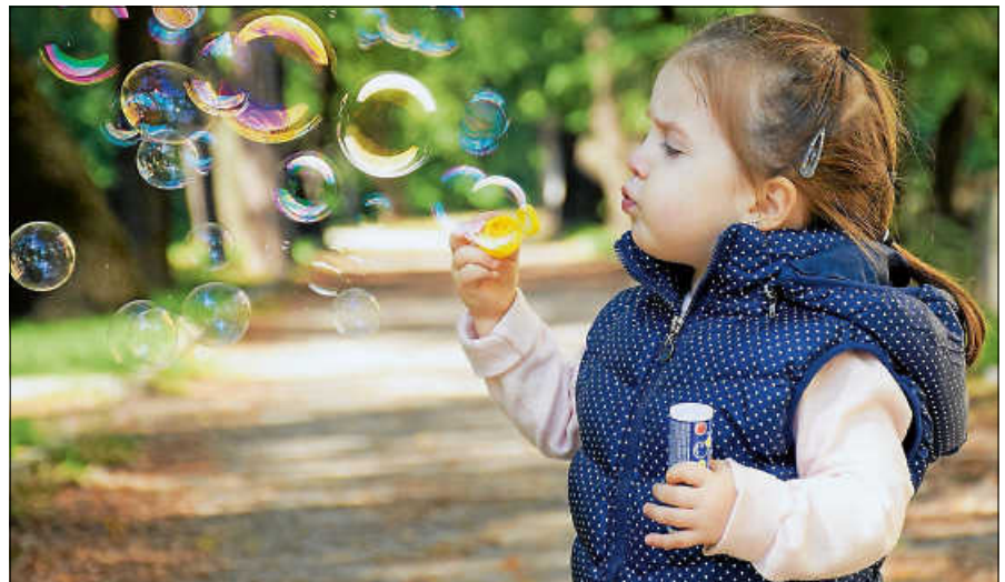
Kindertagespflege ist ein wertvolles und individuelles Betreuungsangebot in Gernsbach.

Um Tagesmutter oder Tagesvater zu werden, ist eine Qualifizierungsmaßnahme auf Grundlage des landesein-