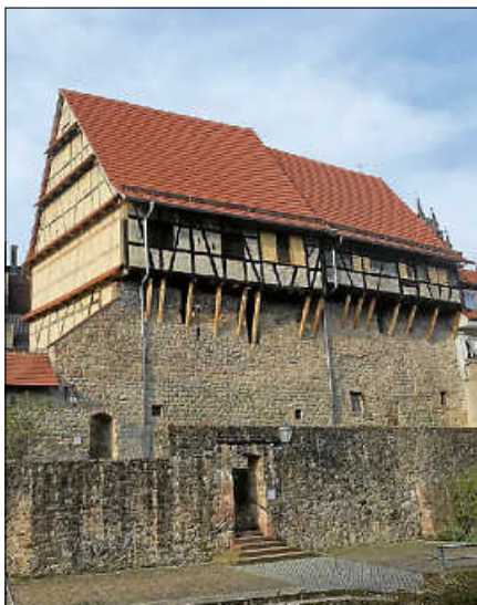
Die Gernsbacher Zehntscheuern der nach Sanierung.

Wir hoffen, dass sich die Lage im kommenden Jahr entspannt, wir den Abend neu ansetzen können und alle Fans wieder begrüßen dürfen. ■