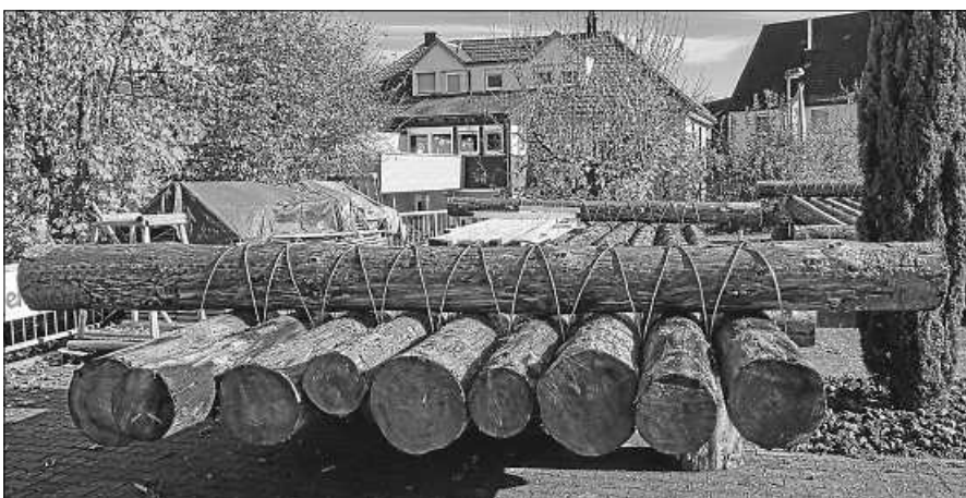
Das neue Floß.

Ein Glück für einen Verein, der in Zeiten von Corona seinen Betrieb halbwegs