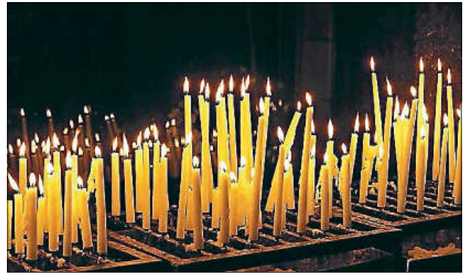
Kerzen zum Gedenken an die Opfer der beiden Weltkriege.

Der Gottesdienst wird am Sonntag um 9 Uhr in der Pauluskirche Staufenberg abgehalten. Die musikalische Umrahmung übernimmt das Eichbaumtrio Staufenberg.