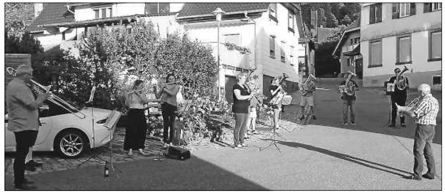
02.07.2020 - am Brunnen vor der alten Kirche.

Als ab März 2020 keine gemeinsamen Proben möglich waren, und ein MVL-Fest oder Gastauftritt nach dem anderen abgesagt wurde, begann für die MVL-Musiker eine schwierige Zeit. Auf der einen Seite Verständnis für die Beschränkungen, waren doch sowohl Dirigent als auch einige Musiker der besonderen Risikogruppe zugehörig. Auf der anderen Seite fehlte natürlich das ‚Lebenselixier‘ der Musiker, die Bestätigung des Publikums für die eigenen Leistungen. Dementsprechend litt die Motivation, zu Hause auf eigene Faust konsequent zu