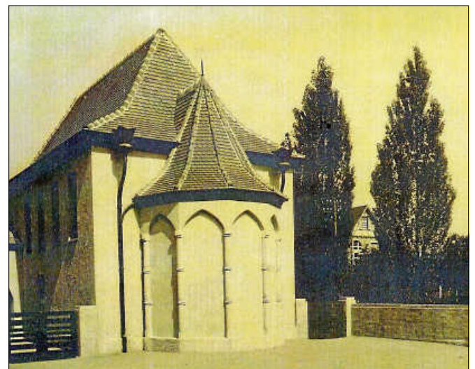
Die ehemalige Synagoge.