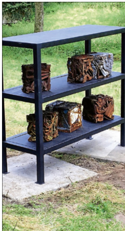
To clear the wrong memory, 2016, Eisen geschweißt, FE-Schrott paketiert 210 x 231 x 86 cm.

Die Arbeit To clear the wrong memory wurde von Sandra Meisel für die Ausstellung 2016 erschaffen. Die gebürtige Karlsruherin, die in Berlin lebt und arbeitet, hat paketierte Eisen-Schrott aus Hamburg kommend in ihrem Berliner Atelier bereits Probe in ein eigens für den Kunstweg produziertes Hochregal gesetzt. „Wie kleine, kostbare Diamanten“ sind diese nun am Kunstweg ausgestellt und laden die Besucher*innen zu einer genauen Betrachtung ein. ■