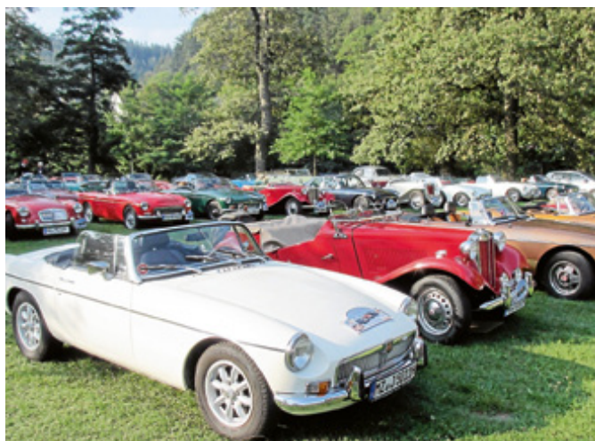
Fast 50 Fahrzeuge waren auf der Murginsel zu besichtigen.