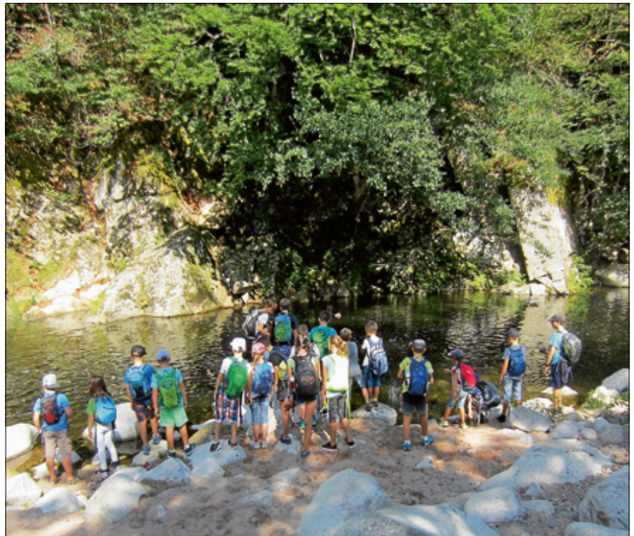
Unten am Fluss - Abenteuer an der Murg

Die richtige Technik könnt Ihr in einem ersten Schnuppertraining lernen und natürlich ein richtiges Fußball-Match spielen. Gegen 12.30 Uhr werden wir ein Eis essen gehen. Die Abholung ist um 13.30 Uhr vor dem Stadion.