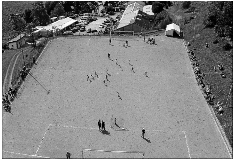
Sportfest FC Auerhahn Reichental, 30.08. bis 01.09.

An allen drei Festtagen wird beim „Ortstunier“ der „Reichentaler Fußballmeister“ ausgespielt und nach dem sonntäglichen Finale bei der Siegerehrung mit anschließender „Champions-Party“ ab 19 Uhr gebührend gefeiert. Als