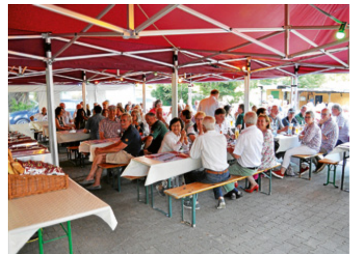
Festbetrieb im Zelt mit „Gala“-Buffet.