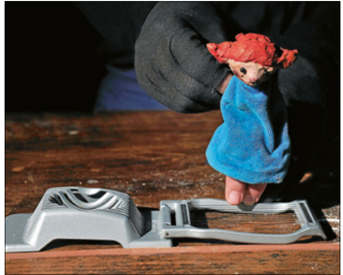
Das Figurentheater Unterwegs präsentiert das Stück „Die Sachenfinderin“ im Rahmen des Gernsbacher Puppentheaters.

Bitte die jeweiligen Altersbeschränkungen beachten. Den Flyer und die Karten gibt es ab Donnerstag, 5. September