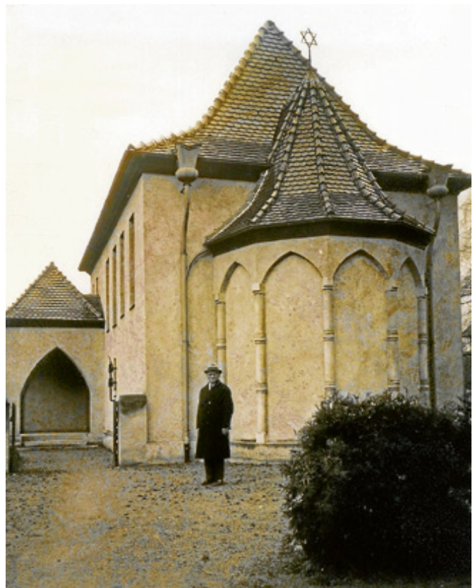
Die jüdische Synagoge um 1938.

Seit vergangenem Jahr gibt es außerdem eine Broschüre zu dem Rundgang „Der Sabbatweg von Gernsbach“, erhältlich in der Tourist-Info Gernsbach. Preis: 5 Euro. ■