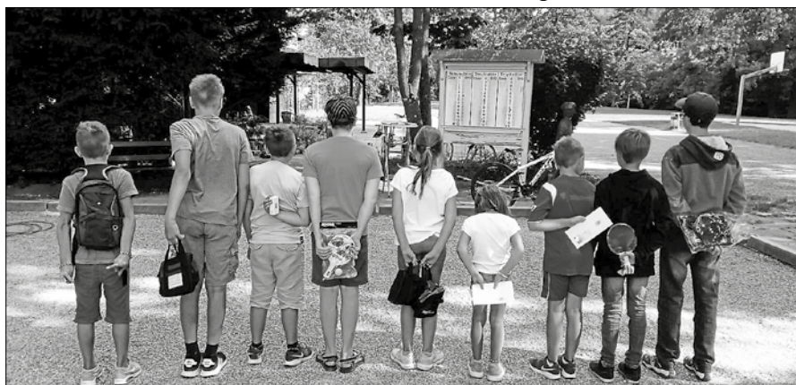
Die Kinder hatten viel Spaß beim Boule.

Alle waren hoch motiviert und mit Spaß bei der Sache. Auch ohne Mitgliedschaft darf jeder gerne täglich zum Spielen kommen. Kugeln sind vorhanden.