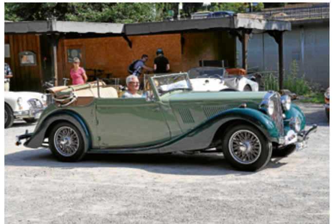
MG-WA, das größte Fahrzeug, das MG jemals baute. Baujahr 1939, 6 Zylinder mit über 2600 ccm. Dieses Fahrzeug ist seit der ersten Zulassung im Familienbesitz.