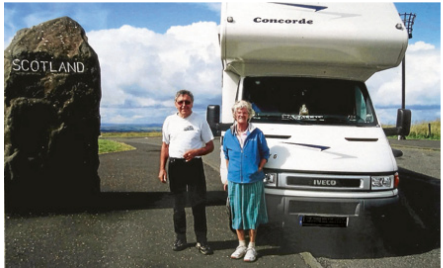
Mit dem Wohnmobil durch Schottland.

Hinderungsgrund. Über seine Erlebnisse und Eindrücke wird der Referent mit eigenen Dias berichten und erzählen, am Montag, 2. September 2019 ab 18.30 Uhr im Vortragsraum des MediClin Reha-Zentrums in Gernsbach. ■