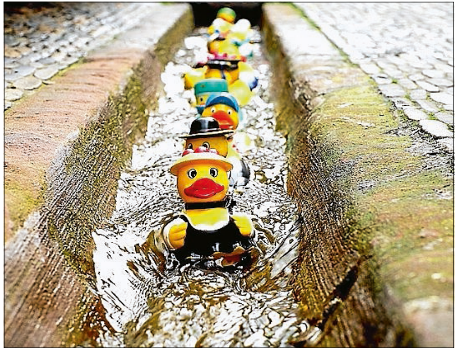
Das schönste Sommerfoto gewinnt.

Vom 19. bis zum 31. August werden jeden Tag zwei Bilder auf Facebook vorgestellt. Anschließend wird das Foto, das bis zum 9. September die meisten „Gefällt-Mir“-Angaben erhält, zum Gewinner gekürt. Doch nicht nur dem ersten Platz winkt ein Preis, auch die Fotografinnen und Fotografen, deren Bilder es auf die ersten fünf Plätze geschafft haben, werden mit einem kleinen Preis und der Veröffentlichung im Stadtanzeiger und auf der Homepage der Stadt Gernsbach belohnt. ■