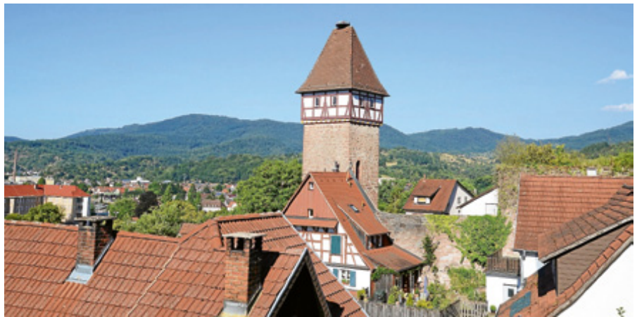
Auch der Storchenturm öffnet seine Pforten an diesem Tag.

Die Programmpunkte in Obertsrot sowie im Kirchl entfallen. ■