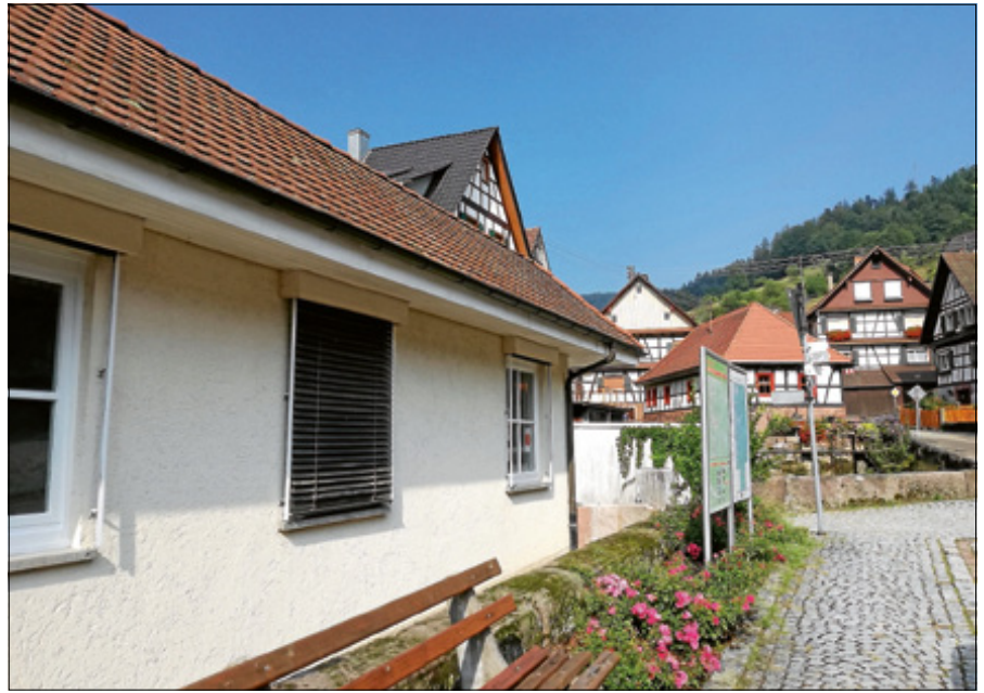
Im Moment wird noch kräftig gewerkelt und vorbereitet im künftigen Dorfladen.

Am Samstag, 28. September 2019, findet von 10.30 bis 15 Uhr ein Eröffnungsfest beim Dorfladen statt. Hier können Kunden dann nicht nur einkaufen, sondern auch bei einer leckeren Wurst und einem Gläschen Sekt gemütlich zusammen sitzen und genießen. Hierzu sind alle sehr herzlich eingeladen. Genauere Informationen wird es demnächst noch geben. ■