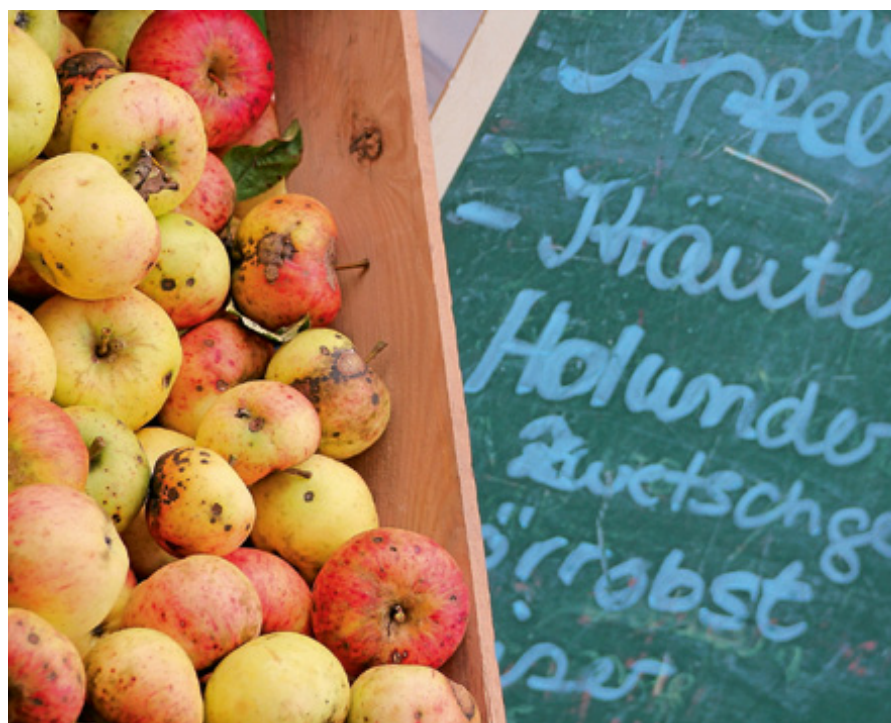
Regionale Produkte laden zum Probieren und Kaufen ein.

13.00 Uhr Musikalische Unterhaltung mit der Stadtkapelle Gernsbach