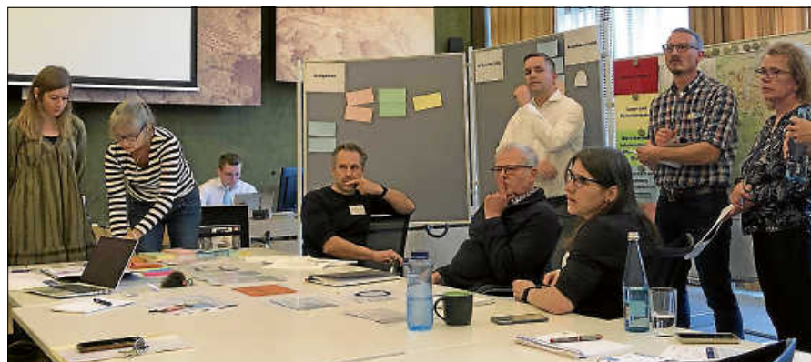
Krisenstab im Rathaus: Übung für den Ernstfall.

Dem vorangegangen waren Workshops, in denen die Stadt Gernsbach gemeinsam mit der EnBW gezielte Strategien für verschiedene Bedrohungsszenarien entwickelte. Jedes Schutzziel wurde dabei individuell geprüft und mit spezifischen Notfallplänen versehen. Diese Pläne wurden im Krisenhandbuch, das alle relevanten Informationen für den Ernstfall bündelt, festgehalten, beispielsweise die Zusammensetzung des Krisenstabes, die Analyse der kritischen Infrastruktur, Ressourcenpläne, Evakuierungsstrategien, Organisations- und Einsatzpläne.