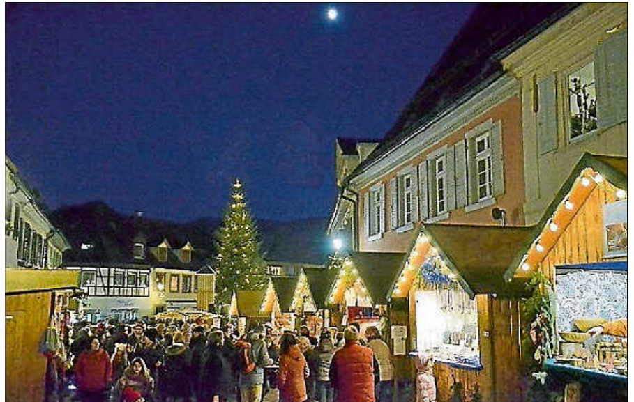
Der Gernsbacher Weihnachtsmarkt.

Traditionell verteilen der als Freund der Kinder bekannte Gernsbacher Schutzpatron und seine Helfer Obst und Naschereien an die Kinder. Um 17 Uhr reitet St. Nikolaus auf den Platz. Für einen schönen Rahmen sorgen die Stadtkapelle mit Weihnachtsmelodien und die Kinder der Grundschule Scheuern mit Weihnachtsliedern. Des Weiteren wird eine Adventsgeschichte vorgelesen. Die Stadtkapelle versorgt Groß und Klein außerdem mit Punsch und Glühwein. Ab ca. 16 Uhr gibt es leckere Waffeln im Kornhaus, um das Warten auf St. Nikolaus zu verkürzen. ■