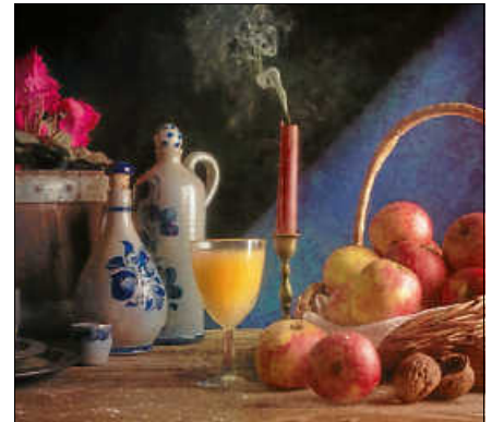
Am Samstag, 23. November ab 16 Uhr lädt der OGV Lautenbach zum Kelterfest ein.

Der OGV freut sich über zahlreiche Besucher - Jung und Alt - aus Lautenbach und den Nachbarorten sowie auf gute Gespräche in ungezwungener Runde.