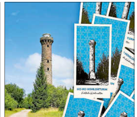
Postkarten zugunsten der Restaurierung des Hohlohturms.

tainbiker. Zugunsten dieses Projekts wird eine besondere Weihnachtskarte mit einem Motiv des Turms angeboten. Der gesamte Erlös des Kartenverkaufs kommt direkt der Restaurierung zugute. Erhältlich ist die Karte bei JØLG, Färbtorstraße 4, 76593 Gernsbach. Eine Karte kostet 2 Euro. ■