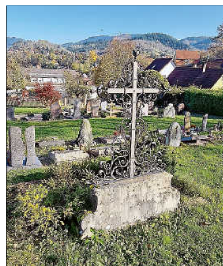
Das angemessene Verhalten auf Friedhöfen ist in der kommunalen Friedhofsordnung geregelt.

Die Friedhofsordnung sowie alle weiteren kommunalen Satzungen, Verordnungen und Richtlinien findet man auf der Homepage der Stadt Gernsbach unter „Stadtrecht / Gernsbach“. ■