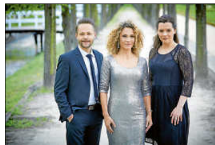
Das Trio „Pariser Flair“.

Besucher:innen werden dabei en passant mehr über die Risiken der Audienz des Komponisten Leonard Bernstein bei Papst Paul IV. erfahren und über die Haustiere und die Hausdame seines Kollegen Andrew Lloyd Webber, denen doch ganz entscheidende Einflüsse auf das Werk zugebilligt werden müssen. Und über die Unverwüstlichkeit des Mutterwitzes von Cole Porter. Die Musicalgala bietet einen unvergesslichen Abend im Stile des New Yorker Broadways und des Londoner West Ends, nicht zu vergessen Paris und Wien, einen Abend voller Glanz und Glamour! Die Veranstaltung in der Stadthalle Gernsbach beginnt um 20 Uhr, Einlass ab 19.15 Uhr.