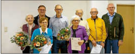
Die geehrten Mitglieder.