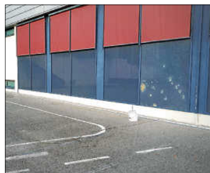
Grobe Beschädigungen an der großen Scheibe rechts außen.

Die Bevölkerung wird darum gebeten, ein Augenmerk auf die Erhaltung öffentlicher Einrichtungen zu haben und gegebenenfalls Beobachtungen polizeilich zu melden. ■