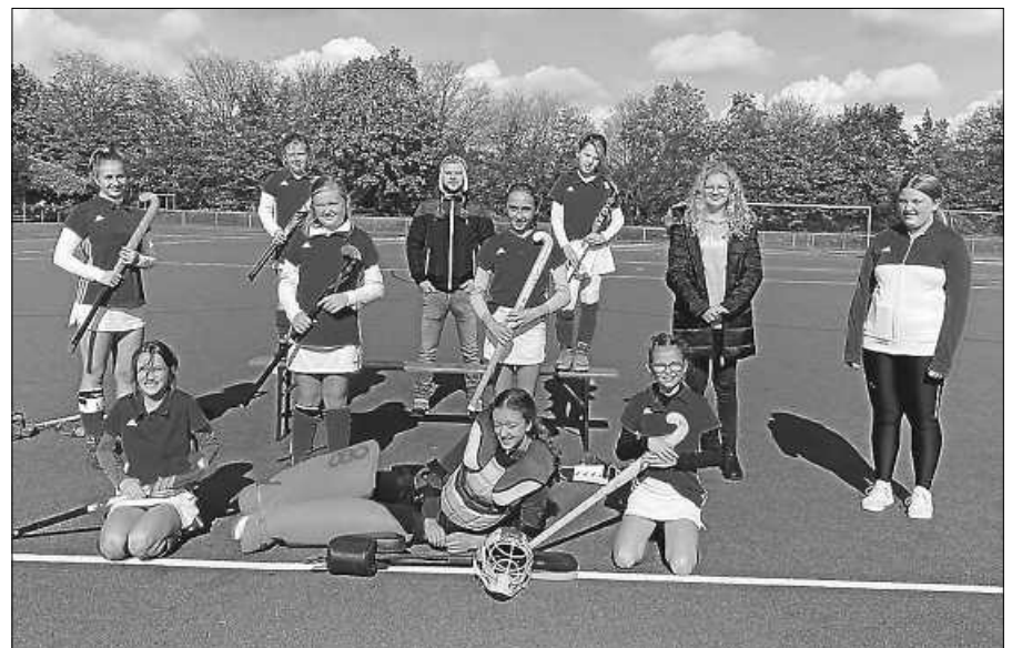
Die A-Mädchen des Hockey-Clubs Gernsbach.