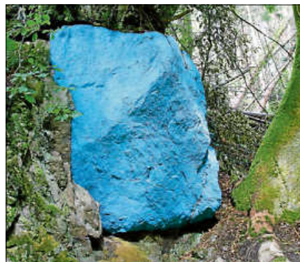
Peco Kawashima "Bruchstück vom blauen Himmel", 2020, Ölkreide auf Granit.

Für Peco Kawashima soll der Kunstweg alle Besucher*innen dazu bringen, ihre Welt, ihre Umwelt und Heimat bewusster wahrzunehmen. Die junge Künstlerin respektiert die Natur und möchte sich mit ihrer Kunst dieser nicht entgegenstellen. In einer malerischen Intervention an einem Granitfelsen mit (viel) Ölkreide in der Farbe Himmelblau erschuf Kawashima Das Bruchstück vom blauen Himmel . "Der Himmel existiert immer über unseren Köpfen. Irgendjemand hat irgendwann entschieden, dass dessen Farbe Himmelblau heißt - dies fühlt sich