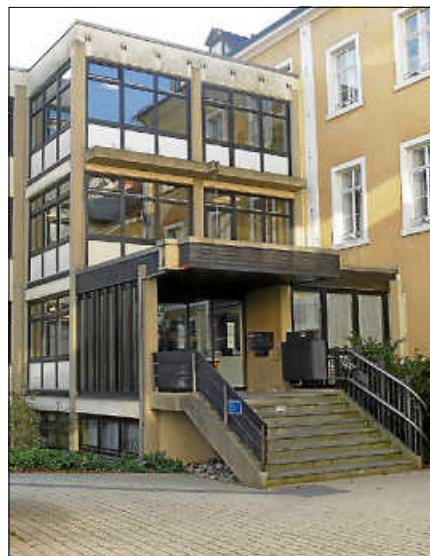
Eingang zum Rathaus Gernsbach.