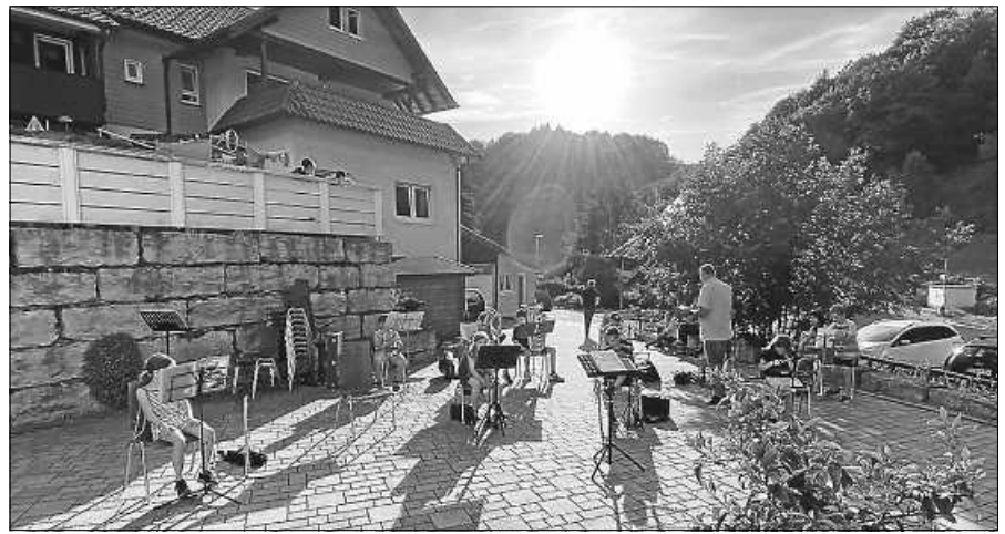
MVL-Jugendprobe im Freien - nicht nur die Sonne strahlt!