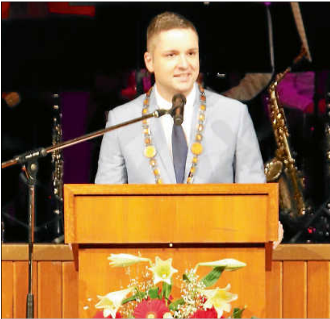
Traditionelle Rede und Begrüßung durch Bürgermeister Christ zum Neujahrsempfang.