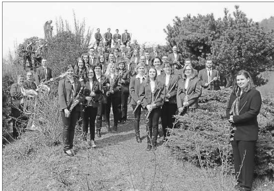
In kleinen Gruppen werden die Musiker in der Kirche St. Mauritius ein Konzert geben.

Das Herbstfest am 8. November muss leider wegen Corona abgesagt werden. Der Musikverein will aber trotz Pandemie die Freude am gemeinsamen Musizieren den Musikern nicht nehmen lassen. Aus diesem Grund haben die