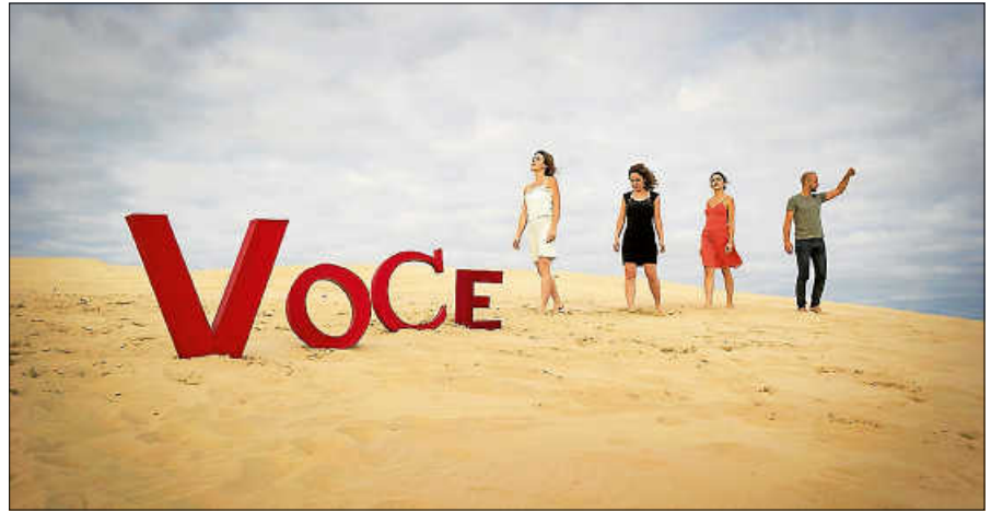
Streichquartett Quatuor Voce

Die Zahl der Eintrittskarten ist wegen der Abstandsbestuhlung reduziert. Die Kulturgemeinde bittet darum, nach Möglichkeit den Vorverkauf zu nutzen. Karten gibt es im Kulturamt/Touristinfo zum ermäßigten Preis von 18 € (Mitglieder 15 €, Schülerinnen, Schüler und Studierende 8 €). Kinder unter 15