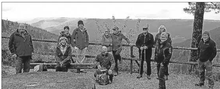
Naturfreunde: Höhenmeter belohnen mit Ausblick.

Ein weiterer Höhepunkt war der naturbelassene Weg durch das Hochmoor Kleemisse. Die wunderschöne Vegetation im Nationalpark begeisterte uns. Nach