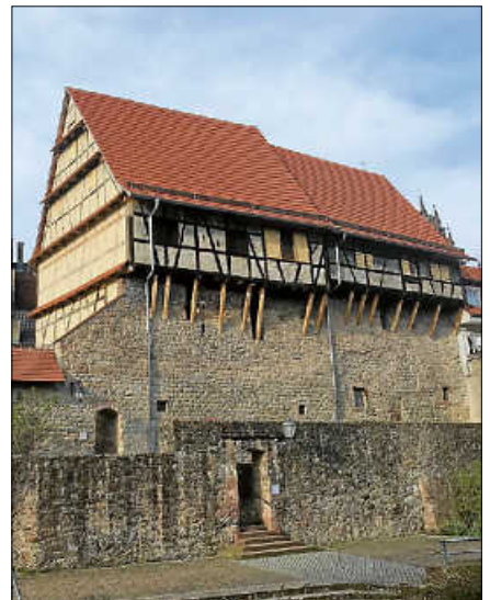
Die Gernsbacher Zehntscheuern der nach Sanierung.