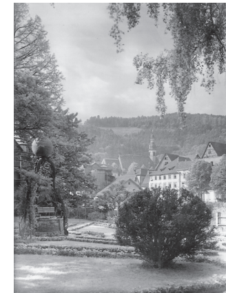
▲ Historische Ansicht des Katz'schen Gartens aus dem Jahre 1928

1849 diente der Garten zur Murguferseite als Gefechtsstellung der preußischen Truppen bei der Badischen Revolution.