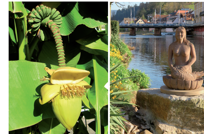
▲ Bananenstaude mit Früchten

Um die wertvolle Gartenanlage mit den darin befindlichen Sammlerstücken und Bauwerken für die Nachwelt zu erhalten, gründete sich im Jahre 1995 der Arbeitskreis Katz'scher Garten. Von 1996-2001 blieb der Garten für die aufwändige Restauration geschlossen, die von ehrenamtlichen Helfern in Zusammenarbeit mit der Stadt Gernsbach vorgenommen wurde.