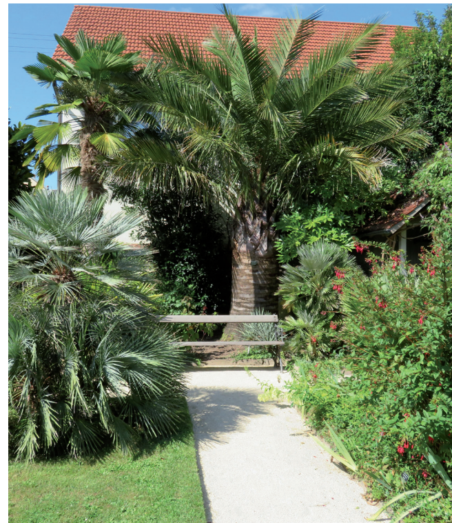
▲ Ruhebänk inmitten der einzigartigen Palmenpromenade

Dank des besonders milden Kleinklimas am Flusslauf der Murg gedeihen hier außergewöhnliche Pflanzen, die dem Garten ein mediterranes Flair verleihen. Mit einer exklusiv ausgepflanzten Palmenammlung mit alleine 16 Arten aus den verschiedensten Ländern der Erde von Argentinien bis Japan, weiter blühenden Bananenstauden, rankenden Passionsblumen mit ihren orangefarbenen Eierfrüchten sowie von der Sonne verwöhnte Granatäpfel im Herbst, zweimal im Jahr