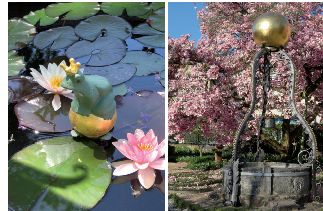
▲ Der Froschkönig thront zwischen farnefrohen Seerosen im Barockbrunnen

Der Grundstein des Katz'schen Gartens wurde Anfang 1800 gelegt, nachdem die feudale Villa auf der gegenüberliegenden Seite der Murgschifferfamilie Katz durch den damaligen Großherzoglichen Baumeister Friedrich Weinbrenner aus Karlsruhe oder seiner Schüler fertig gestellt war. Ein italienischer Gartenbauarchitekt soll den für die ländliche Region ungewöhnlichen Garten geplant und gestaltet haben.