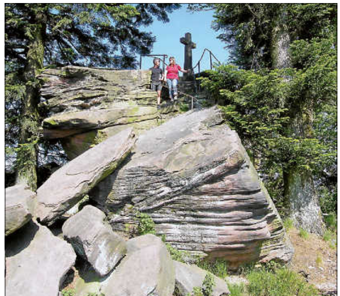
Auf dem Bernstein.

Bahnhof Gernsbach - Laufbachtal - Laufbachbrücke - Sackpfeife - Dreizielstein - Schnepfenheck - Am Gumpen - Sandhütte - (hier verlässt man die offizielle Beschilderung und bleibt auf dem Weg geradeaus, nach ca. 800 m kreuzt ein Westweg-Zubringerweg den Weg, hier biegt man rechts ab Richtung Bernstein) – Bernstein - Gaggenauer Weg - Ottenauer Weg - Sulzbacher