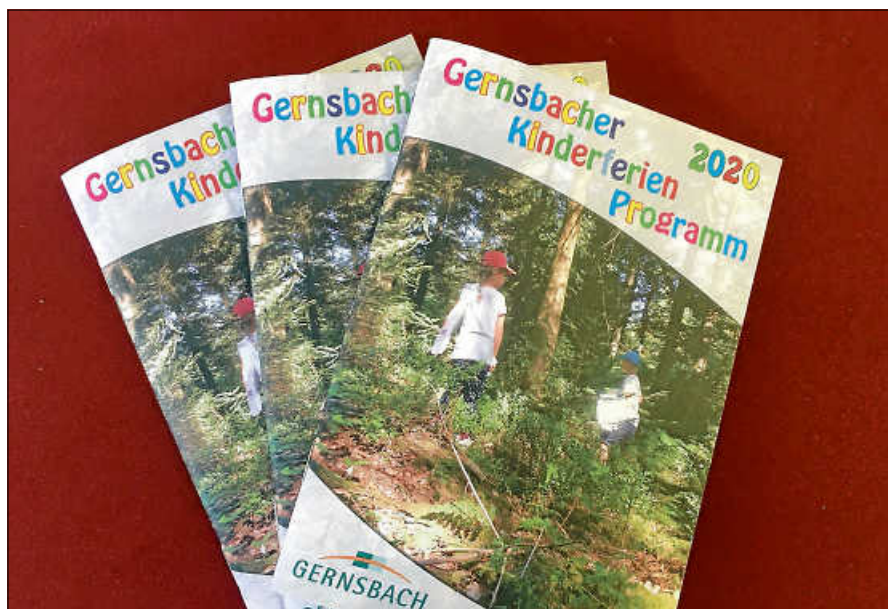
Das Gernsbacher Kinderferienprogramm.

Euch erwarten wunderschöne Stein- und Kieselarbeiten. Ein Deko-Spaß für Garten und Wohnung. Kinder ab 6 Jahre, 14.00 - 16.00 Uhr, Sandweg 7, Gernsbach, P. Bachmann-Schiel