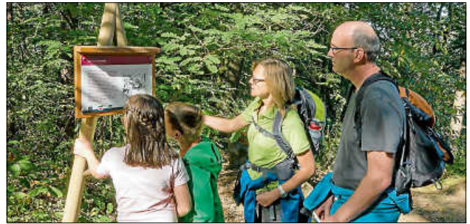
"Das Rockertweibel" - eine Station am Sagenweg.

Die Teilnahme an der geführten Wanderung ist kostenlos, die Teilnehmerzahl begrenzt auf 20 Personen. Eine Anmeldung ist unter Telefon 07224 64444 oder E-Mail: touristinfo@gernsbach.de unter Angabe der Kontaktdaten erforderlich. Kurzsichtschlossene ohne Anmeldung sind herzlich willkommen, sofern noch