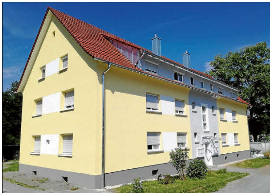
Gelungene Sanierung des städtischen Wohnhauses in der Casimir-Katz-Str. 28 a.