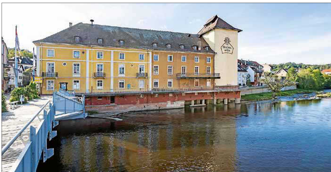
Außenansicht der Brückenmühle.