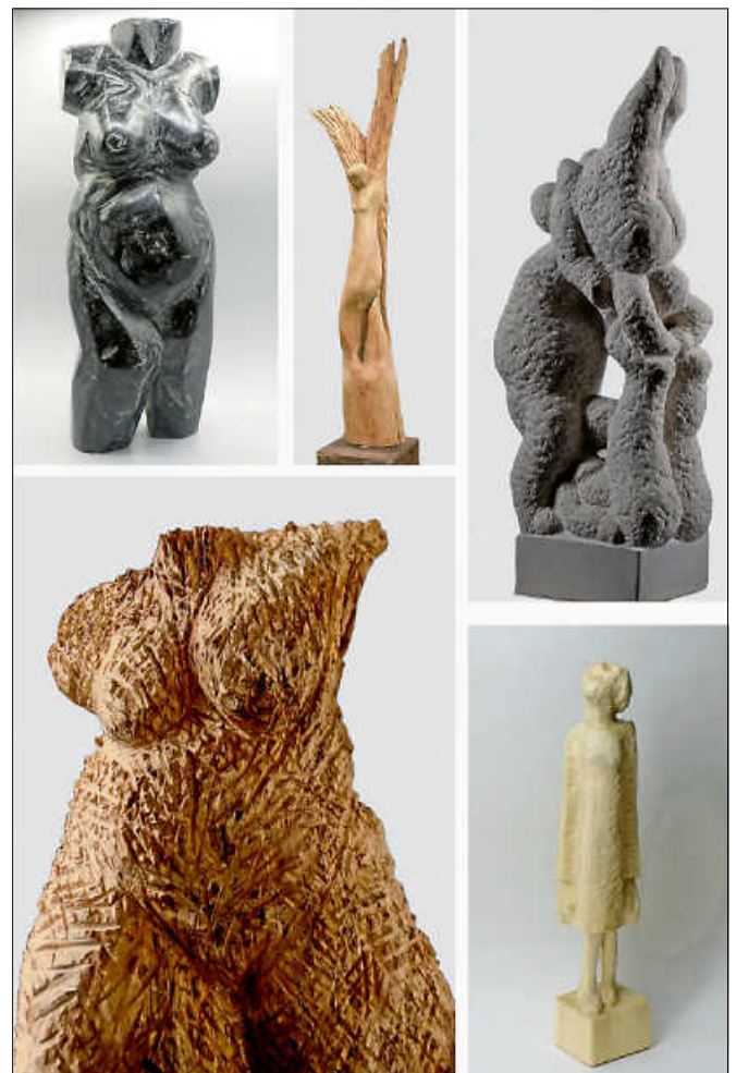
Skulpturen in den Zehntscheuern.