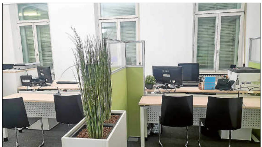
Heller und moderner präsentiert sich ab sofort das Bürgerbüro.

Barrierefrei ist das Bürgerbüro über den Eingang der Tourist-Info zu erreichen.