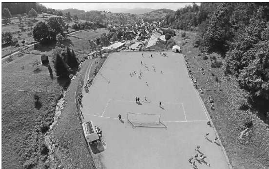
Der FC Auerhahn Reichental freut sich wieder zahlreiche Besucher zum Sportfest 2023 begrüßen zu dürfen.

lichen Finale bei der Siegerehrung mit anschließender „Champions-Party“ ab 19.00 Uhr gebührend gefeiert. Neben den Klassikern vom Grill bietet der Verein seinen Gästen am gesamten Wochenende die legendären FCA-Burger und vegetarische Tomaten-Mozzarella-Brötchen.