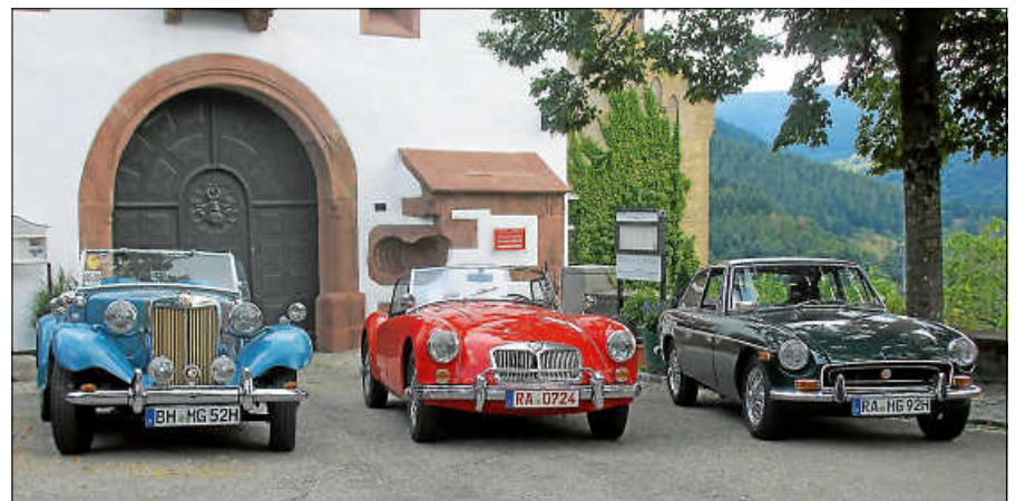
MG-Treffen auf der Murginsel.

9:00 - 12:00 Uhr Spendenfahrten 10:00 Uhr Bratwurst mit Pommes