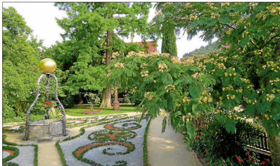
Die komplette Barockornamentik um den Ziehbrunnen wird in verbesserter Form neu hergestellt.