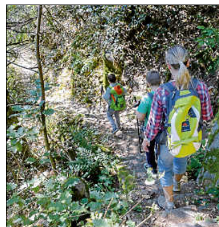
Unterwegs auf dem Sagenweg.

Eine Anmeldung bei der Touristinfo Gernsbach unter 07224 644446 oder touristinfo@gernsbach.de ist erforderlich. ■