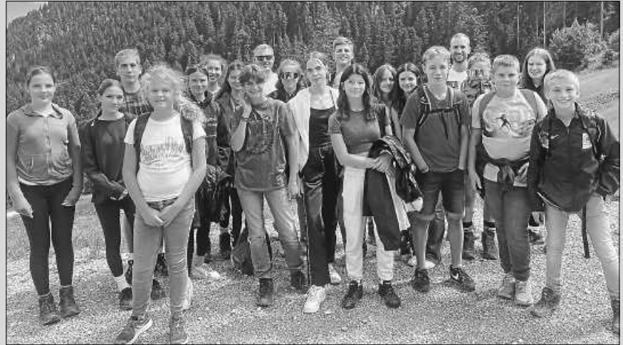
Viel Spaß hatten die Teilnehmer des Ferienlagers in Garmisch-Partenkirchen.

evangelischen Gemeinde Gernsbach auf den Weg nach Garmisch in die „Moun10“-Jugendherberge. Den Bericht können Sie auf der Homepage www.kath-gernsbach.de oder im Pfarrblatt September nachlesen.