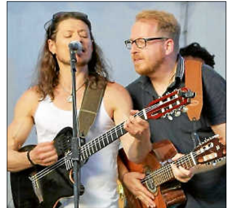
Lateinamerikanische Rhythmen verspricht das Duo 'Clave de Sol'.