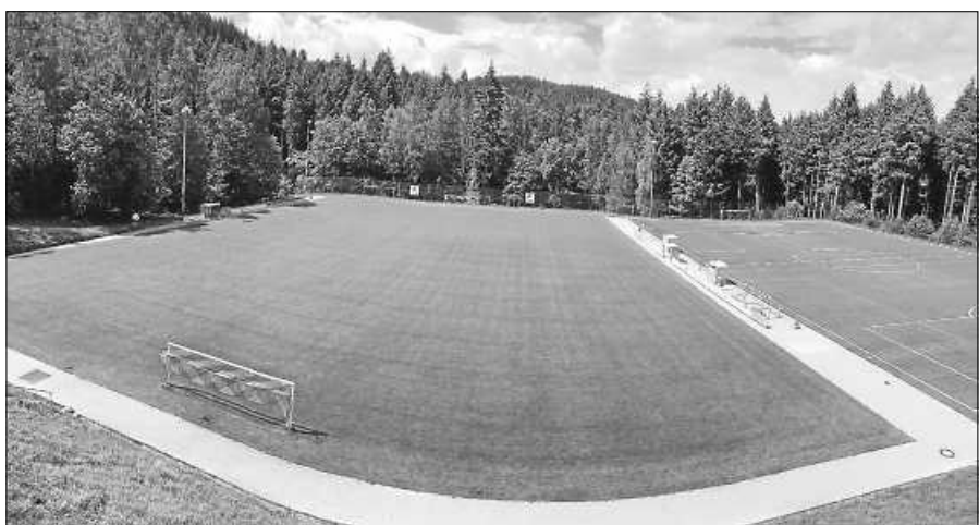
SG SVS/FCG: Am Samstag Heimspiel auf der Auwiese. Danach finden 3 Heimspiele in Gernsbach statt.

legenheit, falls man die Heimspiele als Vorteil ansieht, gleich 4 Mal auf eigenem Platz das Punktekonto aufzubessern. Nach dem Tausch des Heimspielrechts gegen Würmersheim 2 kommt es jedoch zu dieser Heimspielserie. Am kommenden Samstag empfängt man den FV Plittersdorf auf der Auwiese. Spielbeginn ist um 17 Uhr, die Zweite beginnt um 15 Uhr. Danach geht es zu drei weiteren Heimspielen auf das Gernsbacher Areal, dem Walter Rick Sportplatz auf der Fröschau. Hier zur Übersicht, die nächsten Spieltage August und September: Samstag, 26.8.23, 17 / 15 Uhr Heimspiel Auwiese gegen FV Plittersdorf Sonntag, 3.9.23, 17 / 15 Uhr Heimspiel in Gernsbach gegen FV Rotenfels Sonntag, 10.9.23, 15 Uhr Heimspiel in Gernsbach gegen FV Würmersheim 2 (2. Mannschaft spielfrei) Sonntag, 17.9.23, 15 /13:15 Uhr Heimspiel in Gernsbach gegen FV Sandweier Sonntag, 24.9.23. 15 Uhr auswärts in Rastatt 04. Mittwoch, 27.9.23, 18:30 Uhr Heimspiel Auwiese gegen FV Hörden (2. Mannschaft Dienstag, 26.9.23) Auf der Homepage des SVS ( www.svs-staufenberg.de ) kann man sich ebenfalls über die Spieltage informieren.