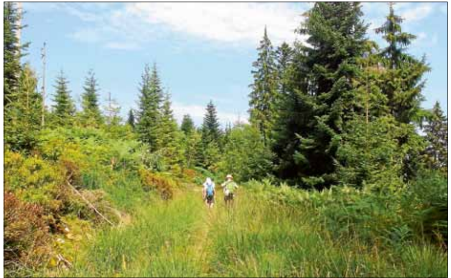
Beim Kinderferienprogramm den Wald mit allen Sinnen erleben.

Dienstag, 13. August - „Ginas Partyrezepte quer durch Europa“ ■