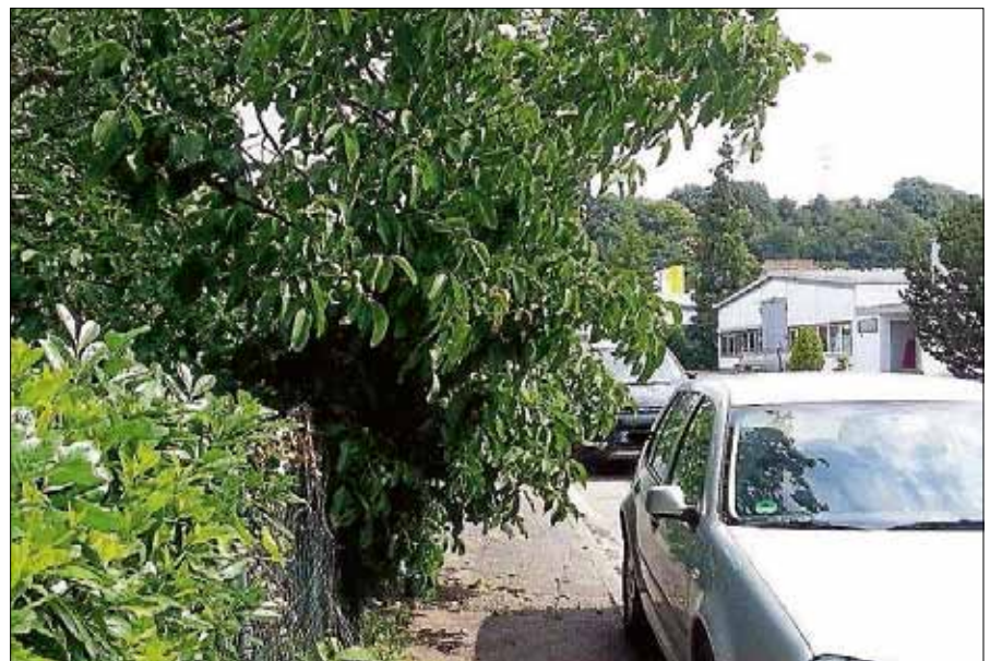
Einschränkungen im Gehwegbereich sind zu vermeiden.

Zwar ist es laut Bundesnaturschutzgesetz verboten, in der Zeit vom 1. März bis zum 30. September Hecken zu schneiden. Maßnahmen zur Beseiti-