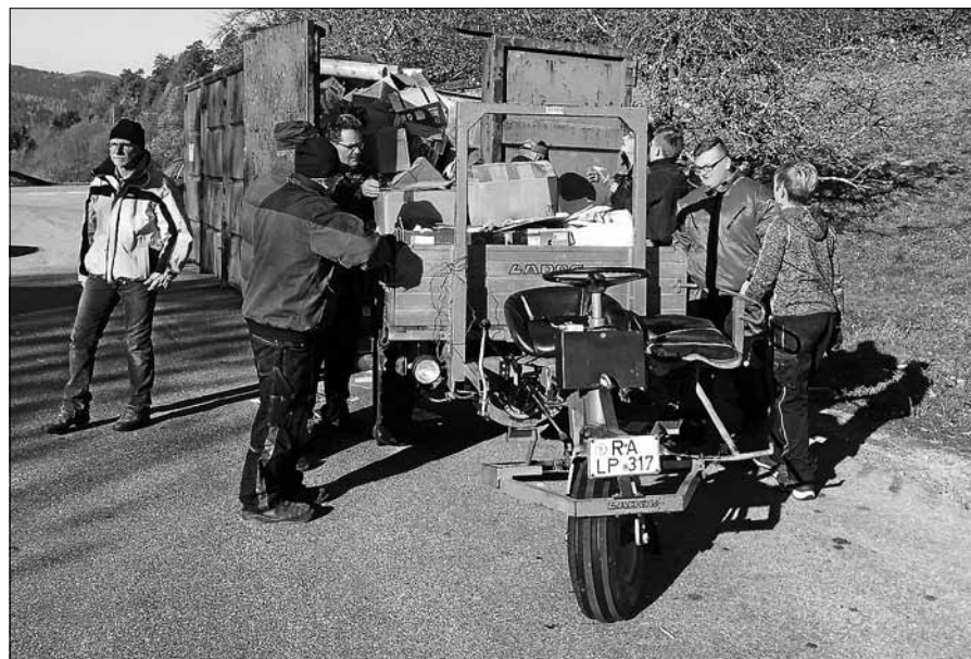
Die Musiker des MV Orgelfels Reichental sammeln am 17. August Altpapier

Obertsrot Mitglieder und Bevölkerung am kommenden Sonntag, den 11. August in das Schützenhaus ein. Eröffnet werden diese Festlichkeiten mit dem traditionellen Schützenhausstammtisch um 10.00 Uhr. Gleichzeitig möchten die Bogenschützen ihren Sport präsentieren und arrangieren für Alt und Jung ein Probeschießen mit Pfeil und Bogen. Zum Mittagstisch ab 11:30 Uhr laden die bekannten Schützenhausschnitzel und mehr ein. Am Nachmittag ist Unterhaltung bei Kaffee und einer großen Auswahl an selbst gebackenem Kuchen, oder bei einem kühlen Getränk, sowie Gegrilltem angesagt. Überdies kommt wieder eine reichhaltige Tombola zur Verlosung. Gegen 16.00 Uhr wird verdienten und langjährigen Mitgliedern mit einer Ehrung gedankt, und um 18:00 Uhr schließt sich die mit Spannung erwartete Königsproklamation an, zu der die Teilnehmer des Königsschießens