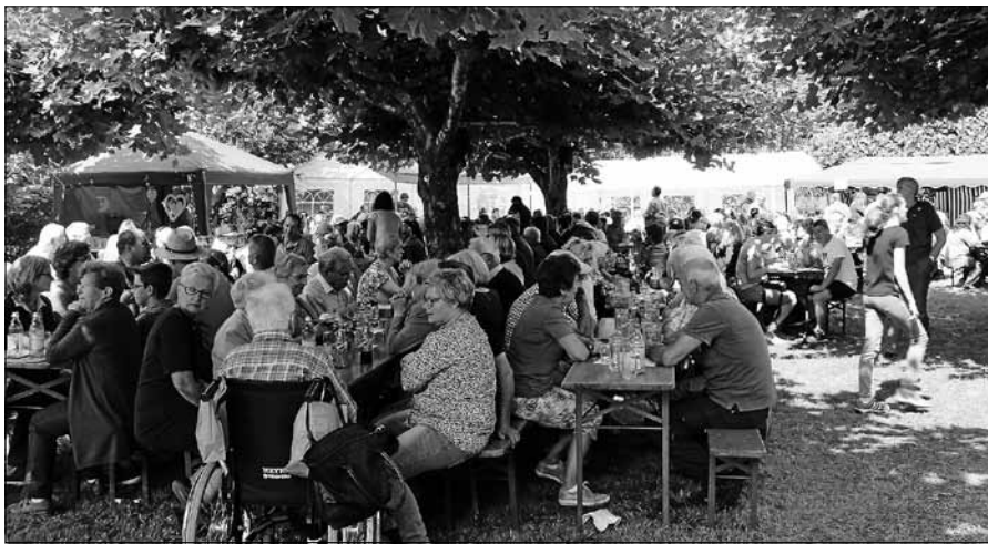
Auch bei wärmeren Temperaturen lässt es sich im Schatten der Platanen gut aushalten.

sorgte aber dennoch für regelmäßige Abkühlung und Erfrischung. Am Freitag nahmen viele Eltern dann strahlende Kinder entgegen, nachdem die Jüngsten noch ihr Tennis-Sportabzeichen abgelegt hatten und mit einer Anstecknadel belohnt wurden.