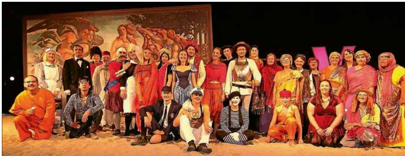
Das tik-Ensemble zeigte in diesem Jahr ‚Was Ihr wollt‘