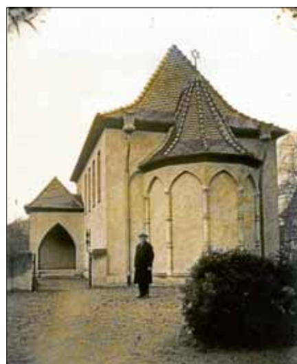
Die jüdische Synagoge um 1938

Treffpunkt: Sonntag, 1. September 2019, 15 Uhr, Kornhaus Gernsbach, Hauptstraße 32. Dauer: ca. 1,5 Stunden. Teilnahme kostenlos. Weitere Informationen zum Europäischen Tag der jüdischen Kultur: www.lpb-bw.de . Seit vergangenem Jahr gibt es außerdem eine Broschüre zu dem Rundgang