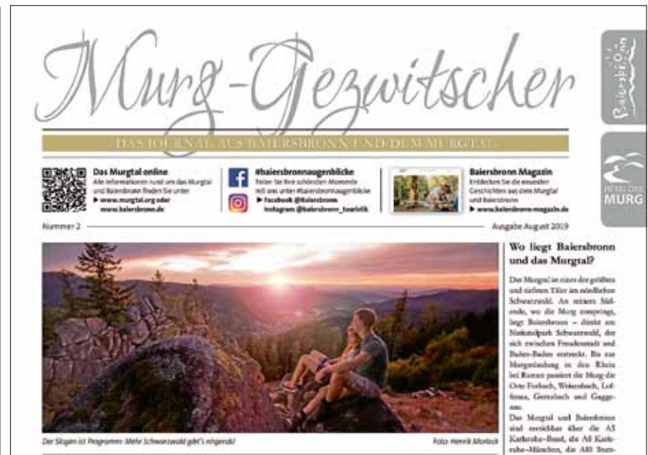
Das neue Murg-Gezwitscher ist da.

Seit Jahresbeginn 2017 arbeiten der Zweckverband „Im Tal der Murg“ und die Baiersbronn Touristik in einer engen Kooperation zusammen. Das Murg-Gezwitscher ist neben dem gemeinsamen Gastgeberverzeichnis und dem Murgtal Wanderguide ein weiteres Printprodukt