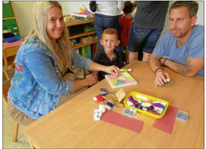
Das Herstellen von Nagelherzbrettern machte allen viel Freude.

In Aktionsräumen boten die Erzieherinnen verschiedene Aktivitäten für Kinder und Eltern an. Das Herstellen von Kissenhüllen, Kinderschminken und dekorative Nagelherzbretter machten allen Beteiligten sichtlich Freude, so dass die Zeit viel zu schnell verging. Hier wurde das Motto: "Wir gehören zusammen – und du bist wichtig", direkt gelebt. ■