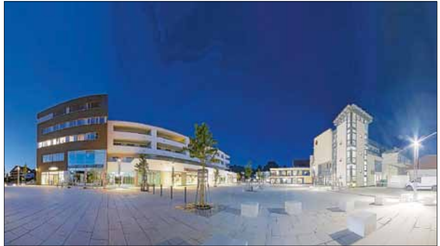
Modernes Ambiente: der Gernsbacher Salmenplatz

Aber auch zukünftige Projekte wie die Neugestaltung des Kelterplatzes wur-