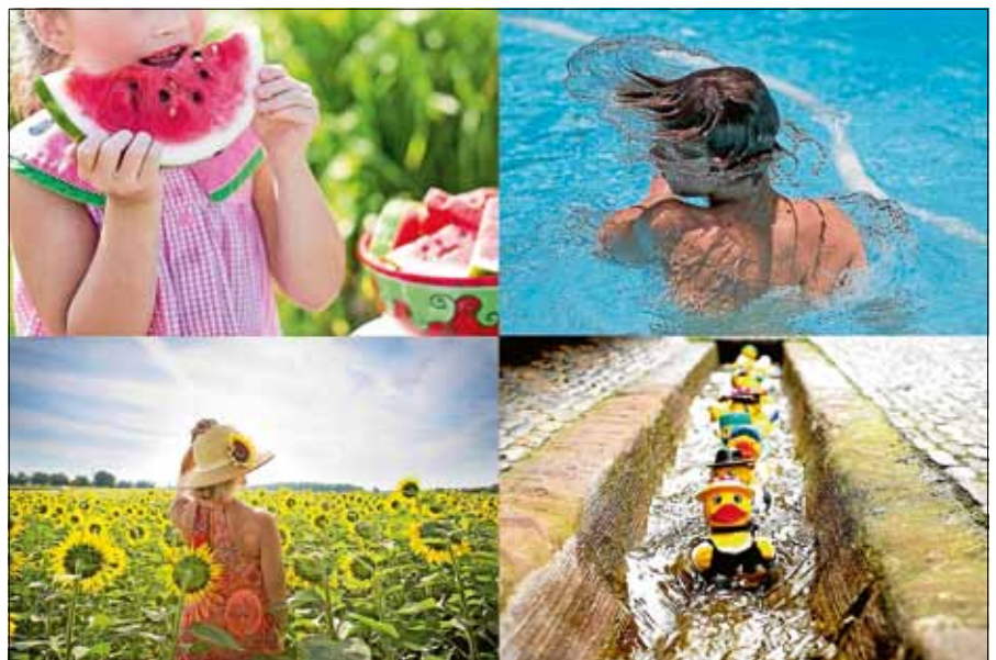
Der Sommer ist bunt - auch in Gernsbach!

Mit Ihrer Einsendung übergeben Sie die Bildrechte zur eventuellen Wiederverwendung an die Stadt Gernsbach. ■