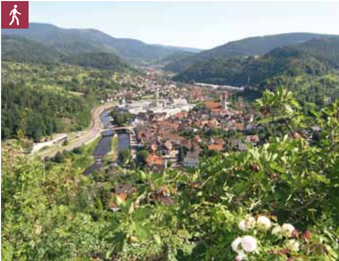
Blick vom Schloss auf das Murgtal