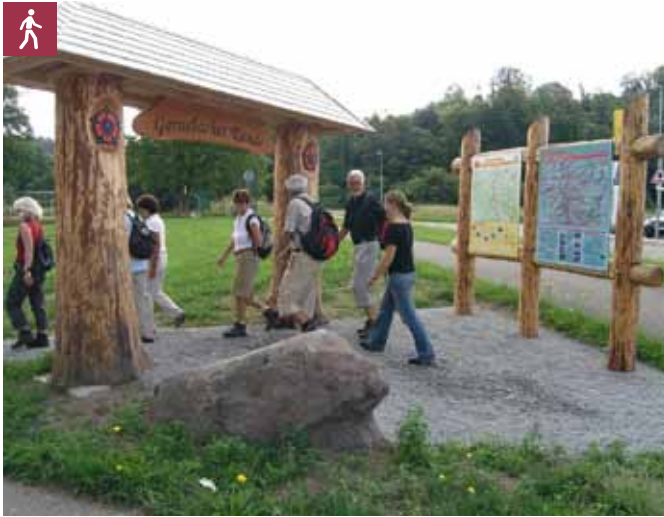
Wanderstart am Portal Gernsbacher Runde

Wanderung über einen Teil des Premiumweges Gernsbacher Runde nach Loffenau und weiter zur Teufelsmühle mit tollem Ausblick. Zurück über die Illertkapelle nach Gernsbach.