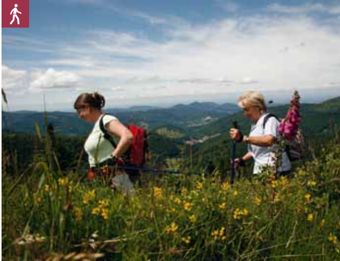
Wanderer Kaltenbronn