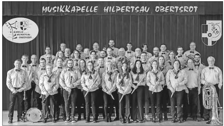
Das gemeinsame Ensemble stellt sich vor.

Dass das diesjährige Bezirkskonzert in der Ebersteinhalle in Obertsrot ausgetragen wird, hat mehrere Gründe. Neben dem 100-jährigen Jubiläum des Musikvereins Hilpertsau ist ein bedeutender Grund auch das neu gegründete gemeinsame Ensemble der Musikvereine Hilpertsau und Obertsrot. Es präsentiert sich erstmalig vor einem großen und anspruchsvollen Publikum mit einem nicht minder anspruchsvollem Programm. Zu hören gibt es unter anderem eine monumentale Blasmusikbearbeitung zur Filmmusik von „The rock“ sowie das programmatische Klanggemälde „Into the raging river“. Die Zuhörer des Bezirkskonzertes werden noch ein weiteres Novum erleben. Kurzfristig fällt leider Michael Wörner, der angestammte Dirigent der Musikkapelle, sowohl für die Probearbeiten als auch für das Konzert aus. So mitten in einer Konzertvorbereitung sorgte dies natürlich für nicht unerhebliche Aufregungen. Aber auch hierfür fand sich innerhalb der Kapelle eine optimale Lösung: Kurzfristig konnte