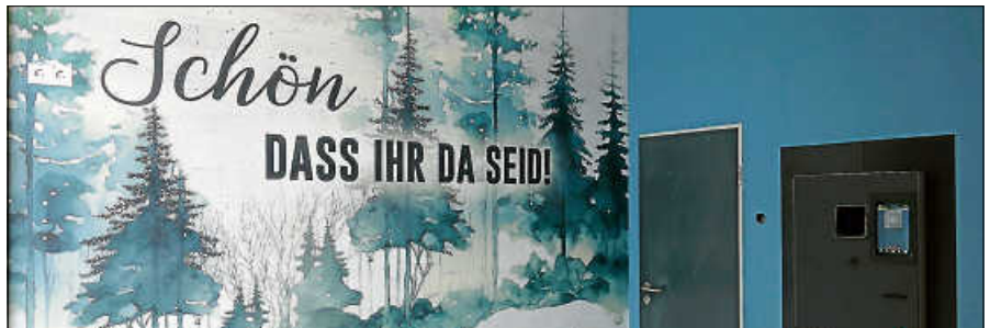
So freundlich wird die Kundschaft am Eingang des neuen Edeka-Fitterer begrüßt.