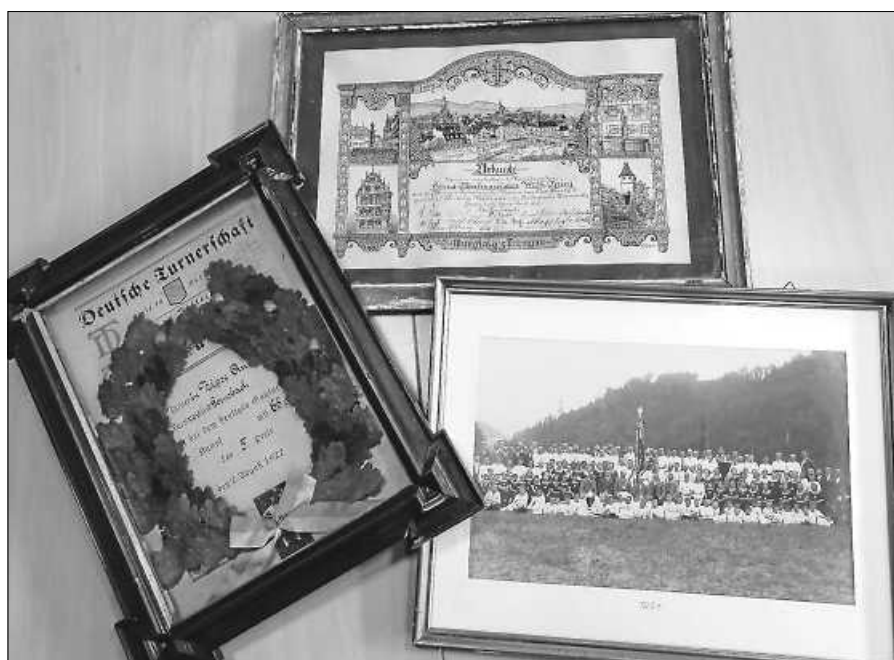
In einer Ausstellung am 10. März zeigt der TV Gernsbach viele Fotos und Exponate, die die Vereinsgeschichte erlebbar machen.

Der OGV-Lautenbach bietet auch in diesem Frühjahr allen Interessierten einen Floristikabend an. Er findet am Donnerstag, 21.03.2024, um 18.30 Uhr im Lautenbacher Bürgerhaus (UG) statt. Entsprechend dem Motto „Floristik im Frühling für Tisch und Tür“ können aus Naturmaterialien frühlingshafte Gestecke und/oder Türkränze für das eigene Heim oder als Geschenk für Freunde und Verwandte erstellt werden. Die Naturmaterialien werden vom Verein ausreichend und kostenfrei zur Verfügung gestellt. Für die Gestaltung eines österlichen Gestecks sollten u. a. ein wasserdichtes Gefäß und die gewünschten Deko-Materialien (z. B. Hase, Henne, ausgeblasene Eier, u.ä.) mitgebracht werden. Erforderlich sind Reb- und Bastelschere, Drahtzange und ein kleines Messer sowie Freude am Gestalten. Wir bitten um umgehende Anmeldung per E-Mail an post@ogv-lautenbach.de oder telefonisch unter Tel. 07224 1085. Es wird keine Teilnahmegebühr erhoben, Spenden werden gerne angenommen. Alle Interessierten aus Lautenbach und