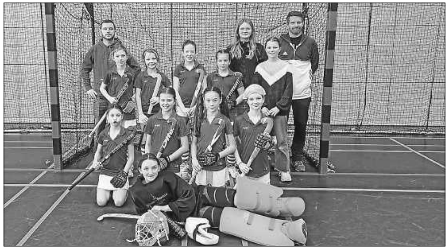
WU10 in Freiburg.

Seit dem 14. Februar unterstützt der KDFB Zweigverein Gernsbach die Solibrot-Aktion, die der KDFB-Bundesverband und das katholische Werk der Entwicklungszusammenarbeit MISEREOR gemeinsam bundesweit durchführen. Als Kooperationspartner hat der KDFB-Zweigverein folgende Bäckereien gefunden: Bäckerei Fischer und Naturbäckerei Weber in Gernsbach, Marktbäckerei Huck in Hörden, Bäckerei Pfistner und das Ottenauer Backstüble in Ottenau, sowie die Marktbäckerei