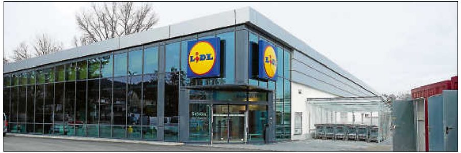
Die neue Lidl-Filiale präsentiert sich im modernen Look.