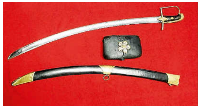
2024: Jubiläumsjahr 175 Jahre Badische Revolution.

Weiterer Termin: Samstag, 6. April 2024, 14 Uhr ■