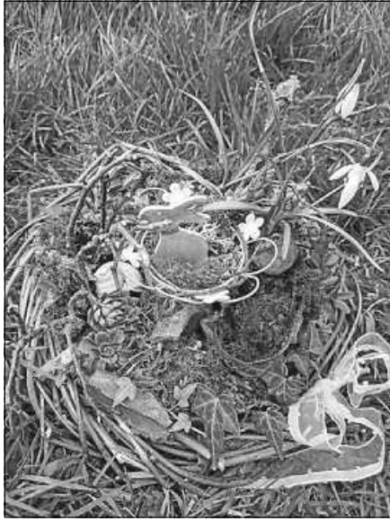
Beim Floristikabend des OGV Lautenbach sind der eigenen Kreativität keine Grenzen gesetzt.

Umgebung sind sehr herzlich zu diesem kreativen Abend eingeladen. Getränke stehen zur Verfügung, ganz bestimmt auch wieder die beliebten „vergorenen“ Köstlichkeiten aus dem Keller des Vereinsvorsitzenden.