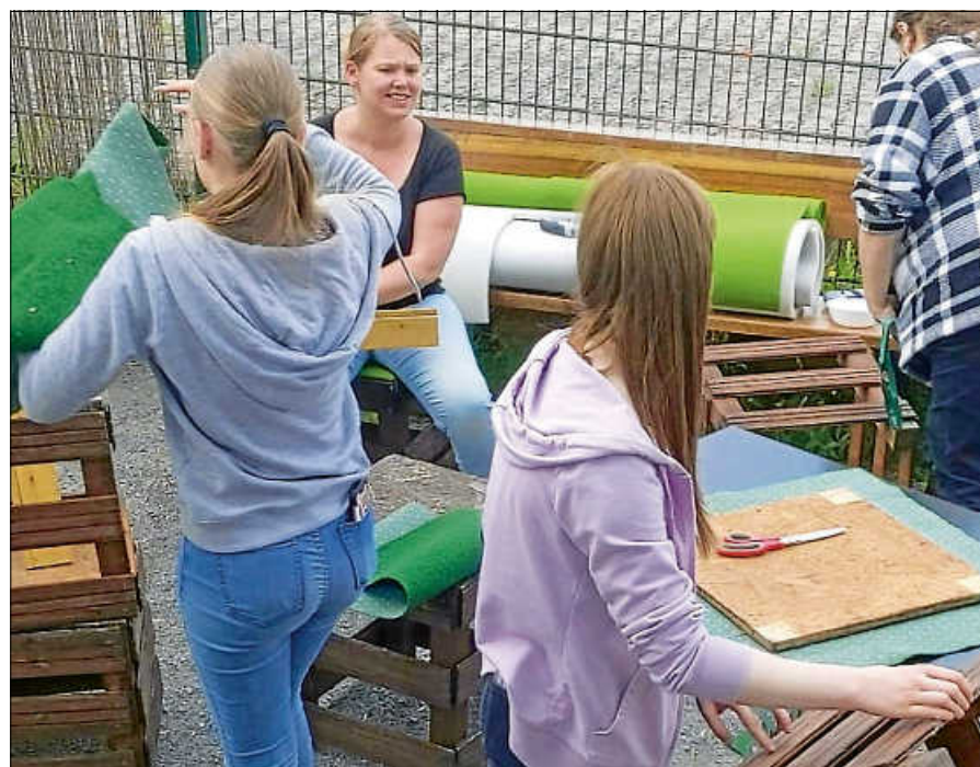
Möbel bauen/ Mädchen*arbeit im Jugendhaus.

Im Rahmen der Mädchen*arbeit öffnet das Jugendhaus jeden Mittwoch von 13 - 20 Uhr zum Mädchen*treff im Gleis 3. Der Mädchen*treff schafft einen sicheren Raum, indem sie sich frei entfalten, austauschen und gegenseitig unterstützen können. Durch Angebote, die speziell auf die Bedürfnisse von Mädchen* zugeschnitten sind, kön-