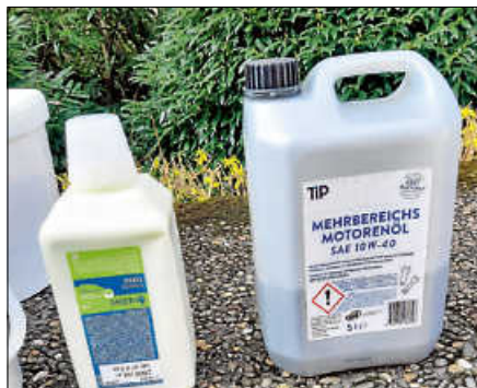
Illegale Gefahrgutentsorgung auf der Baccaratstraße.

Wer das Abstellen des Gefahrguts bemerkt hat oder sonstige Informationen zu diesem unerfreulichen Fund hat, wird gebeten, sich mit der Polizei Gernsbach unter Tel. 07224 3663 in Verbindung zu setzen. ■