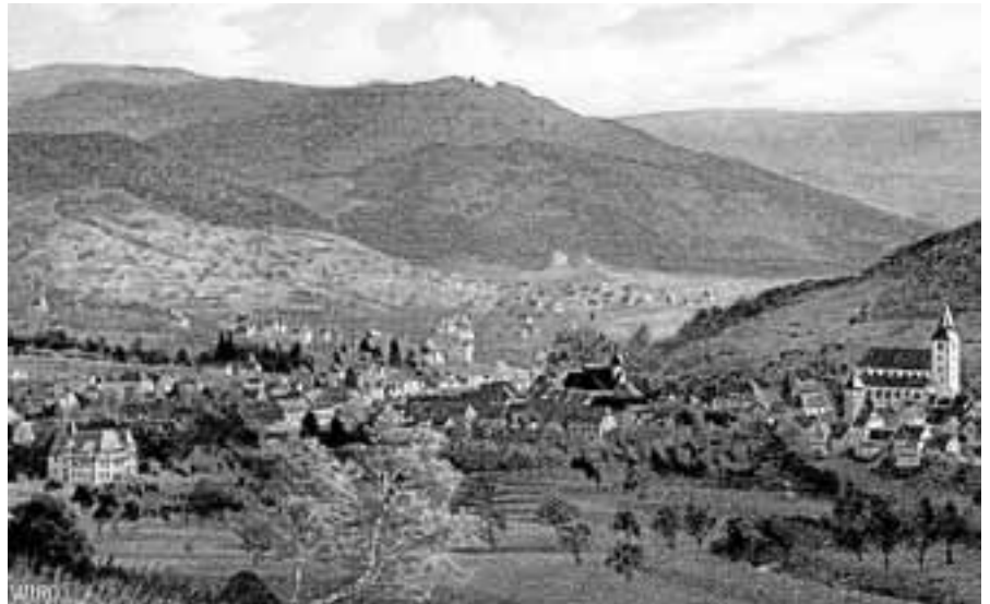
Postkartensammler: Dekorative WIRO-Künstlerkarte, verschickt im Juni 1917.