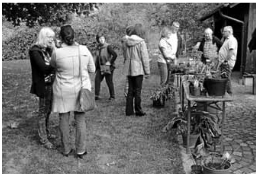
Das Angebot beim Pflanzentauschtag des OGV war groß.

Helfen Sie mit und unterstützen Sie das Projekt „Dorfladen Reichental“. Wir danken Ihnen für Ihre Unterstützung und stehen bei Rückfragen gerne zur Verfügung. Guido Wieland, Telefon 40749, und Andreas Kozlevcar, Telefon 655767.