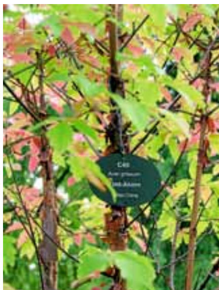
Auch der Zimt-Ahorn aus Mittelchina findet sich im Gernsbacher Kurpark.

Gisela Plätzer und Rudolf Koch haben in einem ersten Schritt über 200 Bäume ausgesucht und bestimmt. Mehr als 80 Bäume hat Gisela Plätzer beschildert, Schilder für neue Pflanzungen kommen