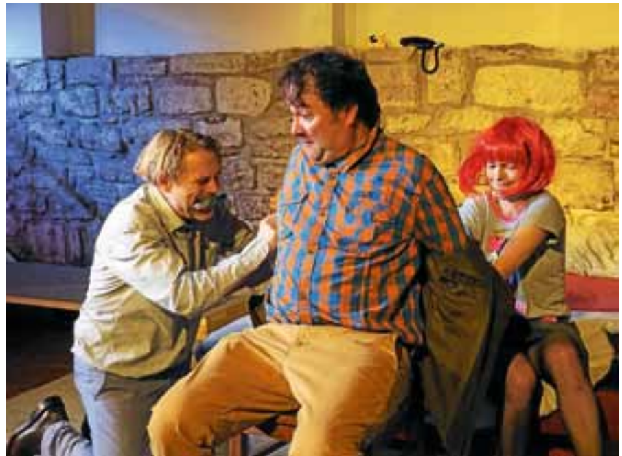
Diese Ménage-à-trois ist ganz schön stressig und wirklich lebensgefährlich!

Leider geht in der Durchführung einiges schief, Paul überlebt, versöhnt sich mit Arlene und beide planen nun, Mitchell zu beseitigen. Auch dies misslingt, das