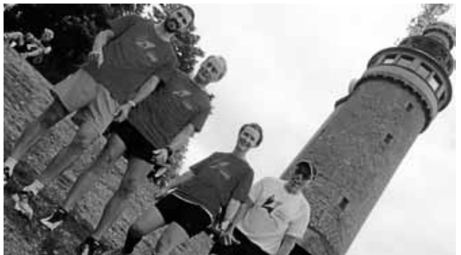
Die Läufer der BSC Glatfelter am Ziel beim Merkurturn.

Blut wird nicht nur für Notfall-Operationen benötigt, sondern auch beispielsweise im Rahmen einer Geburt. Allein 19 Prozent aller Blutpräparate in Deutschland werden jedoch für Patienten mit einer Krebserkrankung benötigt. Viele Operationen und auch Transplantationen sind nur möglich, wenn ausreichend Blutpräparate vorhanden sind. Oft genug ist eine Rettung nur durch eine Blutübertragung möglich. Für einen Spender ist es nur ein kleiner Aufwand. Einige Menschen vergessen diese Spen-