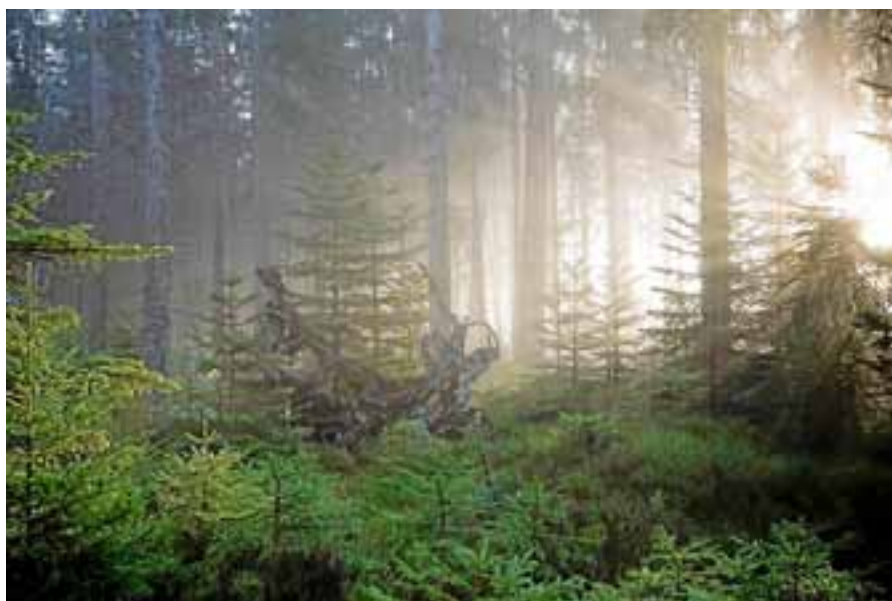
Dem Geheimnis der Natur auf der Spur sind die beiden Infozentrum-Angebote.

Am Sonntag, 14. Oktober, um 11 Uhr geht es zudem den Kräutern auf die tiefere Spur. Bei „Die Seele der Pflanze“ werden die Botschaften und Heilkräfte aus dem Reich der Kräuter gehört und erlebt. Kann schon das Betrachten oder das Einnehmen von Blütenessenzen