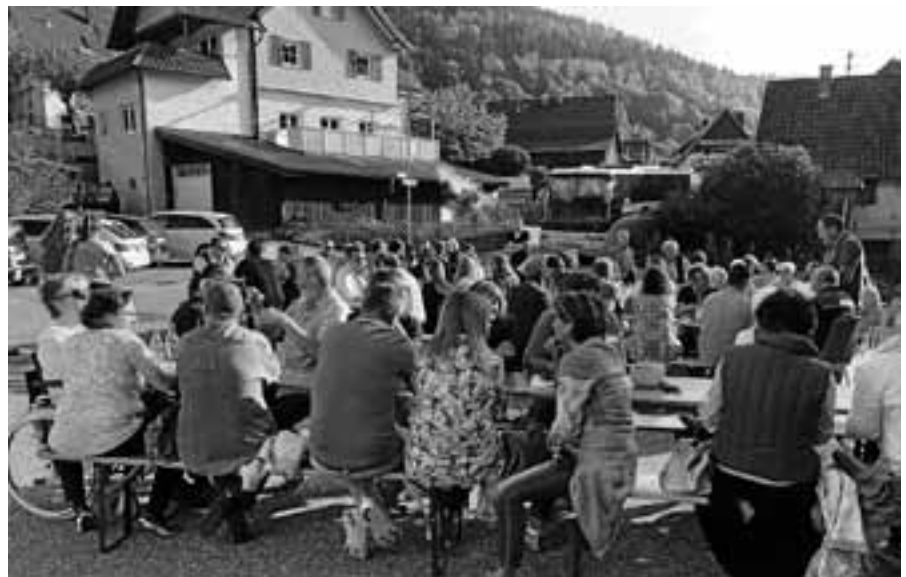
DasKnödelfest des MV Lautenbach lädt zum Genießen vor dem Bürgerhaus ein.