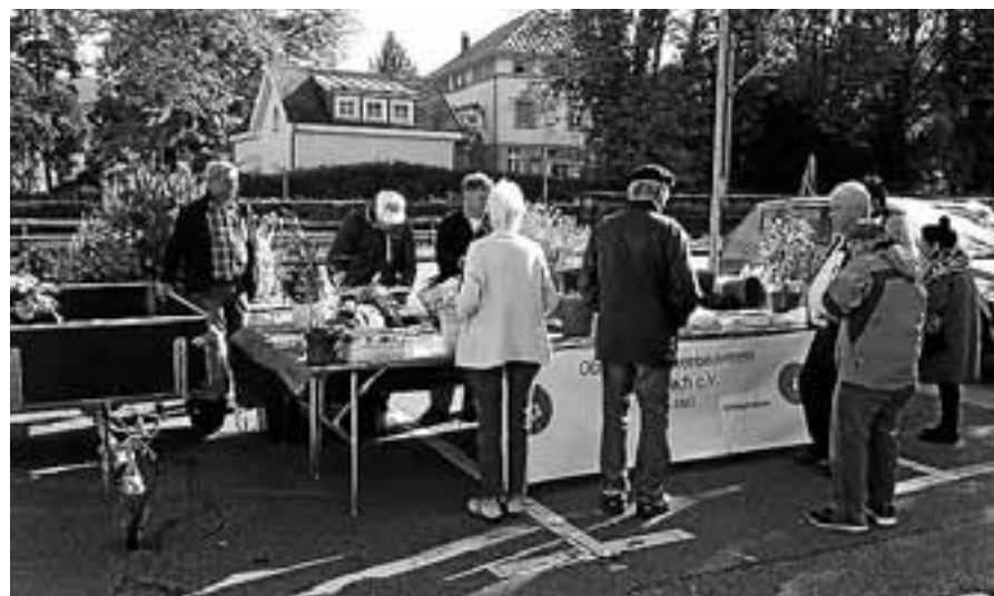
Der OGV führte eine Umtopfaktion auf dem Salmenplatz durch.

Auch in diesem Jahr können beim Obst- und Gartenbauverein Gernsbach wieder