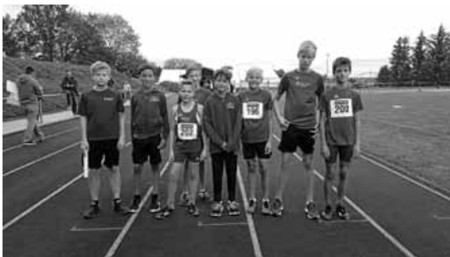
TVG-Leichtathleten MU14 beim badischen Finale in Karlsbad-Langensteinbach.

Die erste Herrenmannschaft war ersatzgeschwächt nach Bühlertal gereist. Ersatzmann Filipovic zeigte sich als Matchwinner und gewann beim Gernsbacher 9:7-Sieg beide Einzel. Die Dritte schlug in der Kreisklasse B souverän den TV Lich-tental mit 9:3. Mit 9:3 verlor die Vierte in der gleichen Klasse gegen Angstgegner