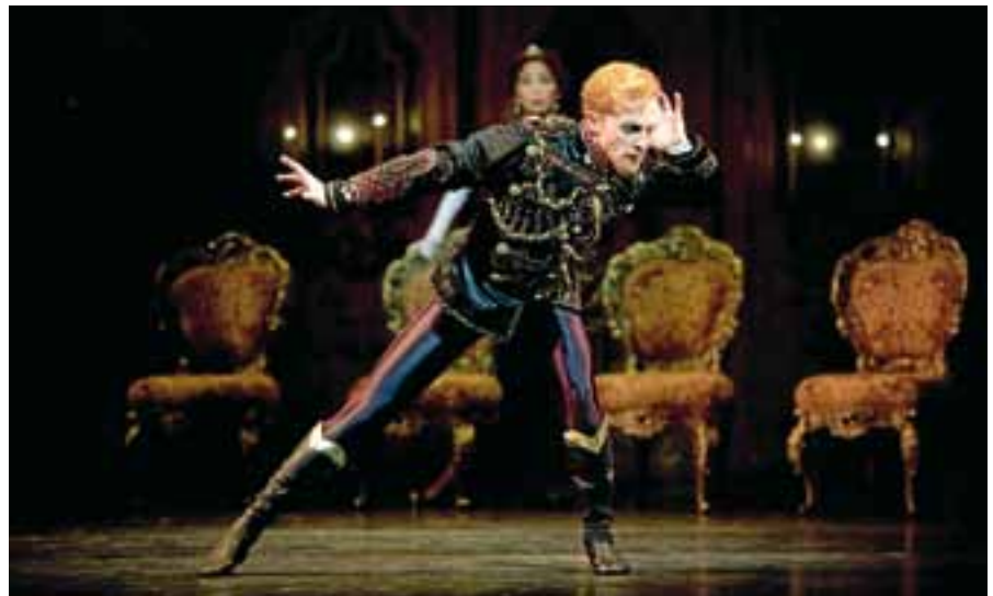
"Mayerling" handelt von Kronprinz Rudolf und seiner Geliebten Mary Vetsera.

Die düster-quälende und emotional aufwühlende Produktion taucht ein in den Glanz des österreichisch-ungarischen Hofes. Am Mittwoch, 17. Oktober, um 19.30 Uhr folgt mit dem 80er-Jahre-Disco-Hit "Flashdance" schon das nächste Highlight der Woche. Gezeigt wird das Original - für das Auge