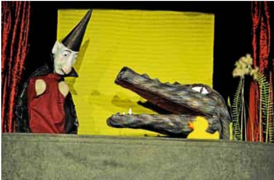
Das Theater Gugelhupf spielt ein spannendes und lustiges Kaspertheaterstück.

A m Sonntag, 4. November, 15 Uhr, präsentiert das Puppentheater Gugelhupf aus Gernsbach das Stück „Das Krokodil im Entenweiher“. Das Stück für Kinder ab vier Jahren ist die zweite Aufführung der Herbst-/Wintersaison der Puppentheaterreihe.