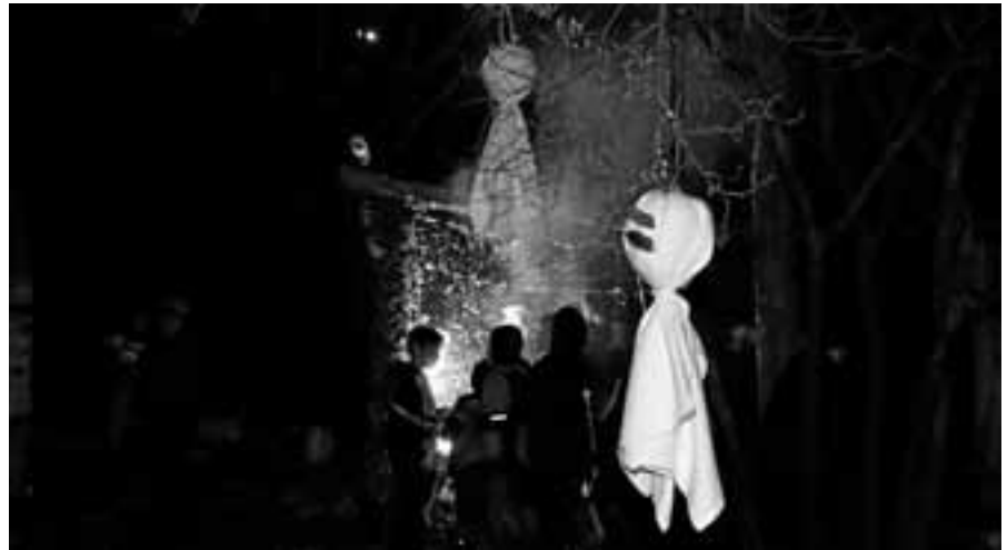
Geisterstunde auf dem Dorfplatz.