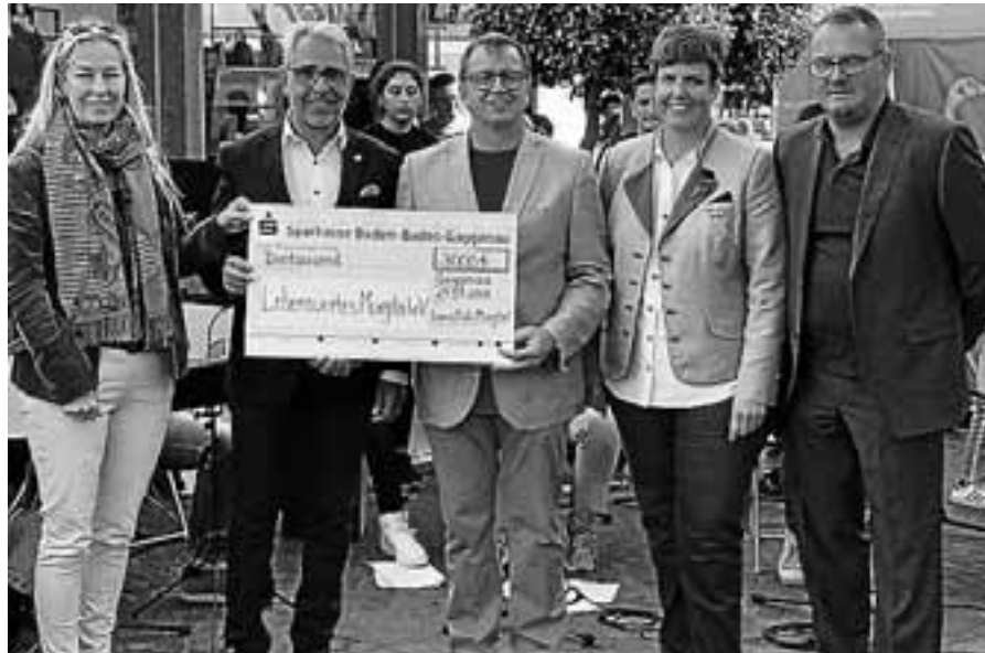
Verein Lebenswertes Murgtal erhält einen Spendenscheck.

Freitag, 12. bis Sonntag, 14. Oktober: Wanderfreizeit im Naturpark Pfälzer Wald. Die Region um Neustadt an der Weinstraße in der Westpfalz bietet Möglichkeiten für Wanderungen im herbstillichen Mischwald, Kiefern- und