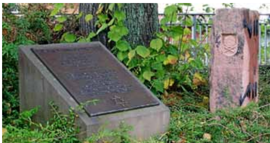
Zwei Gedenksteine nahe der Stadtbrücke erinnern an die Deportation der letzten neun jüdischen Bürger in das Lager Gurs. An dieser Stelle findet alljährlich die Gedenkfeier statt.