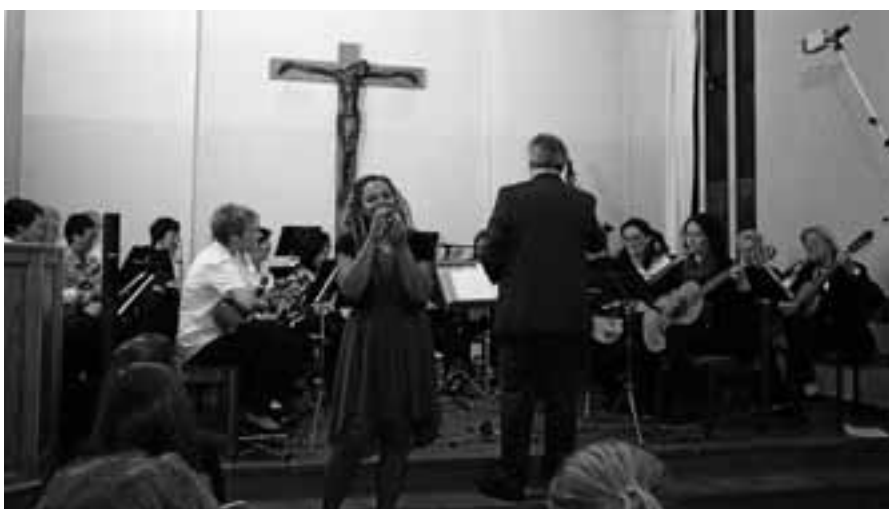
Das Mandolinen- und Gitarrenorchester lädt zum Jahreskonzert ein.

Bei schönstem Spätsommerwetter fanden am 22. September wieder viele Interessierte den Weg in die Staufenberghalle zum KidsBazar. Die Halle war mehr als gut gefüllt mit Spielzeug,