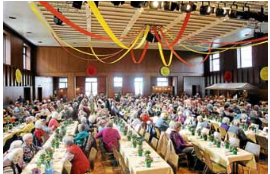
Gemütliches Beisammensein der Senioren im letzten Jahr.