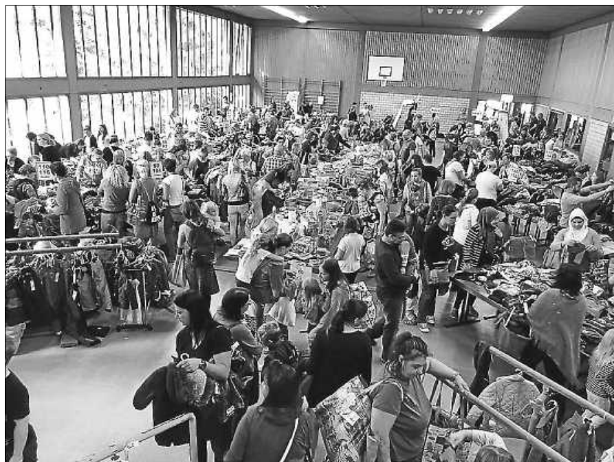
Ein breit gefächertes Angebot erwartet die Besucher.