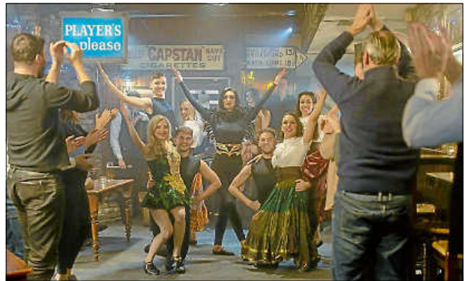
Die Tänzerinnen und Tänzer der Show "Flying Feet".