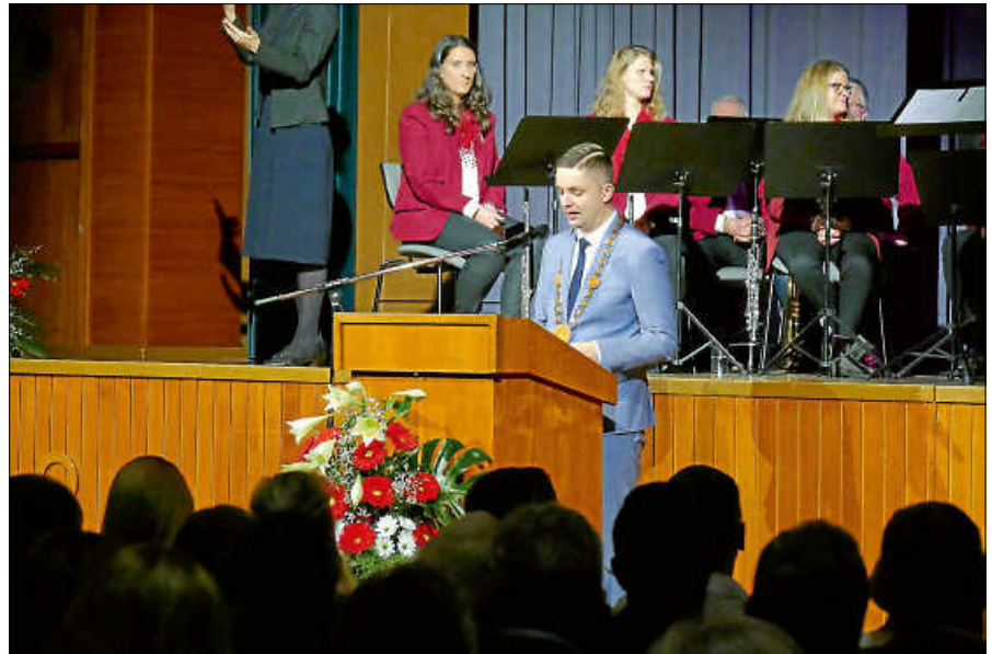
Auch der Neujahrsempfang 2022 kann nur online stattfinden. Archivfoto: BM Christ und die Stadtkapelle 2020.

Bürgermeister Christ bedauert die Absage des Neujahrsempfangs in der Stadthalle sehr: „Auch wenn das Video mit dem Gernsbacher Jahresrückblick und die Neujahrs-Ansprache zumindest noch online stattfinden können, ist dies kein Ersatz für die persönlichen Begegnungen zum Jahresauftakt mit den Gernsbacherinnen und Gernsbachern. Auch müssen erneut die Ehrungen der verdienten Ehrenamtlichen in diesem Rahmen entfallen.“ In der Hoffnung, dass vielleicht im weiteren Verlauf des Jahres 2022 wieder Veranstaltungen zu-