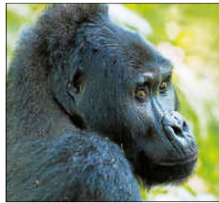
Uganda-Heimat der Berggorillas.

Die irische Tanz- und Musikshow der Extraklasse „Flying Feet“ kommt am 22. April 2022 in der Stadthalle Gernsbach. Beginn der Veranstaltung ist um 20 Uhr.